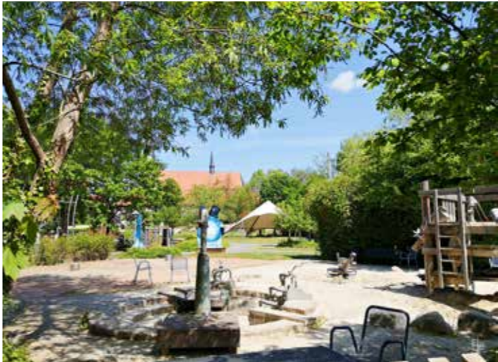
LNS-Park mit Spielplatz und Bühne

Flächen und deren naturnahe Strukturen, Erreichbarkeit verschiedener Anlaufpunkte, Einbezug der Duderstädter Dörfer und touristischen Ziele in der Region, Belebung der Innenstadt und deren Anknüpfung an mögliche Ausstellungsflächen, Kulturangebote und Gastronomie, Bildung, Einbezug der Schulen, Vereine und Institutionen, Ökologie, Biodiversität, Klima- und Energieaspekte gehörten zu den Inhalten, die in Stichworten auf den jeweiligen Tafeln festgehalten wurden.