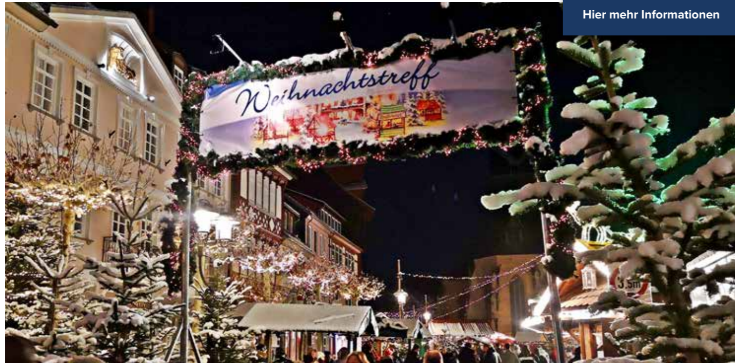
Schlemmen und Flanieren auf dem kleinen aber feinen Duderstädter Weihnachtsmarkt

Der Duderstädter Weihnachtstreff beginnt am Montag, 27. November, um 17 Uhr und öffnet dann bis zum 23. Dezember von montags bis samstags 11 Uhr bis mindestens 19 Uhr und sonntags von 13 Uhr bis mindestens 19 Uhr.