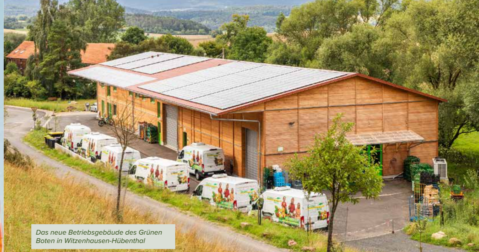
Das neue Betriebsgebäude des Grünen Boten in Witzenhausen-Hübenthal

Unseren Katalog finden Sie unter www.apelreisen.de oder wir senden Ihnen ein Exemplar zu! Wir freuen uns auf Sie.