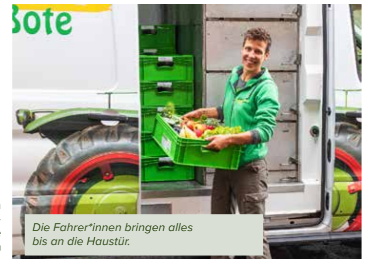
Die Fahrer*innen bringen alles bis an die Haustür.

Grüner Bote GmbH & Co. KG DE-ÖKO-006 Hübenthal 14 37218 Witzenhausen info@gruener-bote.de Tel.: 05542-71077