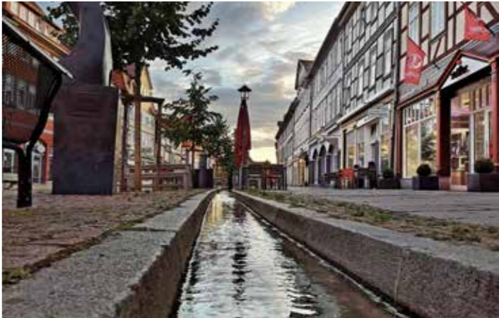
Im Rahmen der LNS entstanden - Fußgängerzone mit Brehmelaufl

Städtebau, den Landschafts-, Natur- und Umweltschutz, sowie die Gartenkultur und Landschaftsarchitektur geben. Sie sind damit ein integraler Bestandteil der Gemeinde- und Stadtentwicklungspolitik und unterstützen das lokale Handeln der Kommunen."