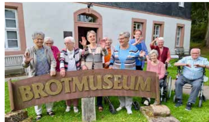
Ausflüge zum Brotmuseum gehören zu dem gewohnten Angeboten.

Das Altenpflege- und Senioren-Wohnheim „Am Park“ liegt idyllisch mitten im Herzen der historischen Altstadt von Duderstadt. Das Haus bietet viel Wohnkomfort unter einem Dach: Zimmer mit moderner, pflegebedarfsgerechter Ausstattung, zum Teil mit klimatisierten Räumen, behagliche Gemeinschaftsräume, begrünte Wintergärten über drei Etagen, Sonnendachterrasse sowie eine parkähnliche Gartenanlage. Sogar ein Friseur befindet sich direkt im Haus.