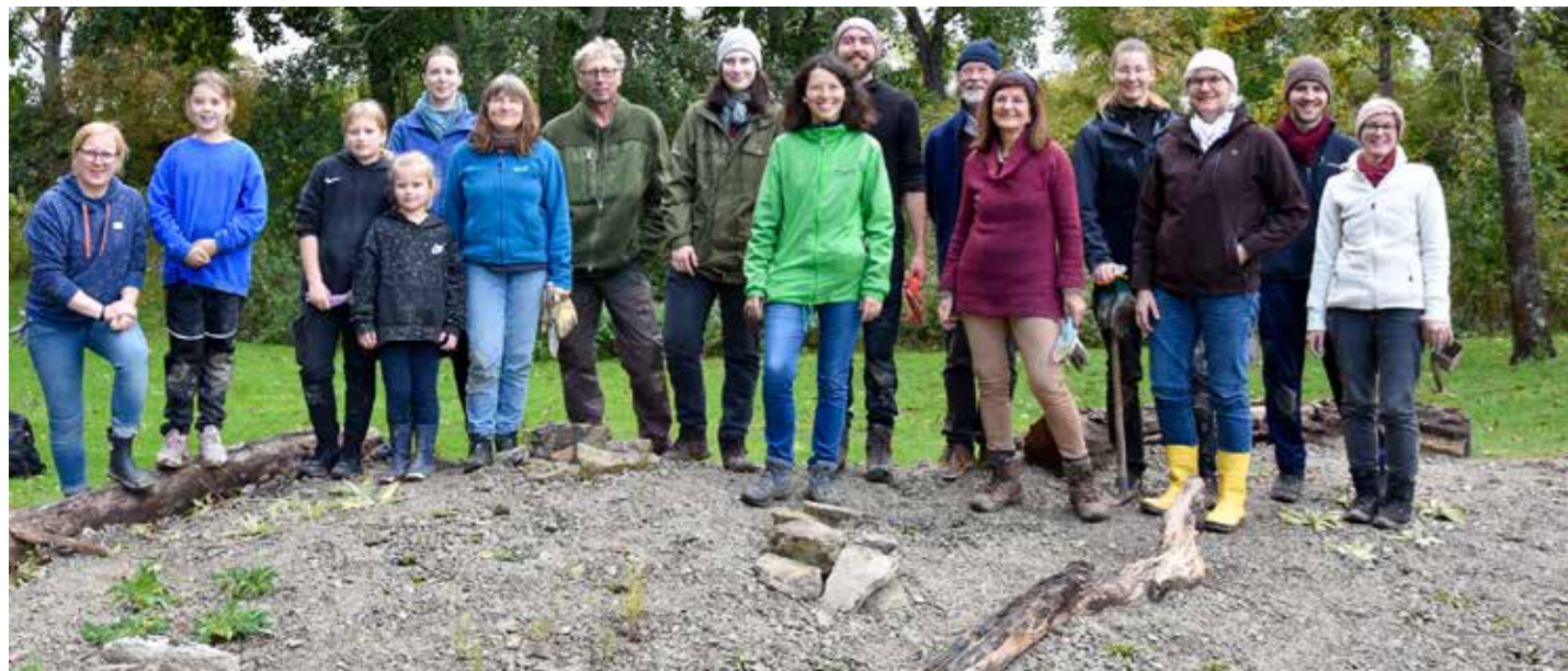
Duderstadt ist Modellkommune für Insektenschutzprojekt

Duderstadt wird Modellkommune für ein Insektenschutzprojekt des BUND. Dazu wurde ein Kalkmagerhügel aus durchlässigem Substrat am Obertortteich angelegt und von Freiwilligen im Rahmen einer Fortbildung zum Insektenschutzbeauftragten bepflanzt. Zur langfristigen Betreuung der Fläche werden noch ehrenamtliche Blühpaten gesucht, die sich für mehr Biodiversität im Innenstadtbereich engagieren möchten.