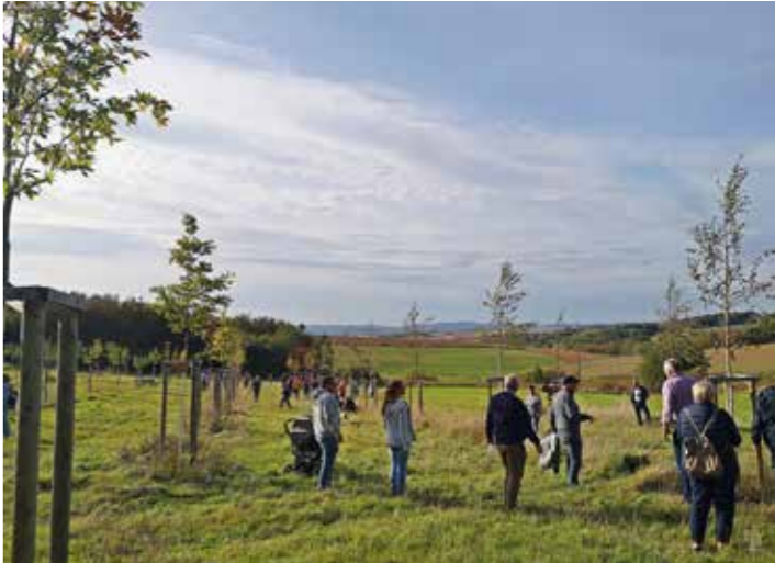
Baumpflanzaktionen, z.B. im Bürgerwald, als Weiterentwicklungen der LNS