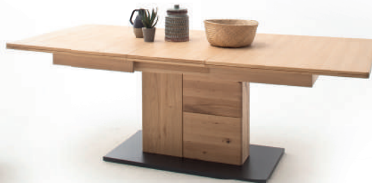
3 | Esstisch