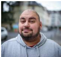
BORA Bora