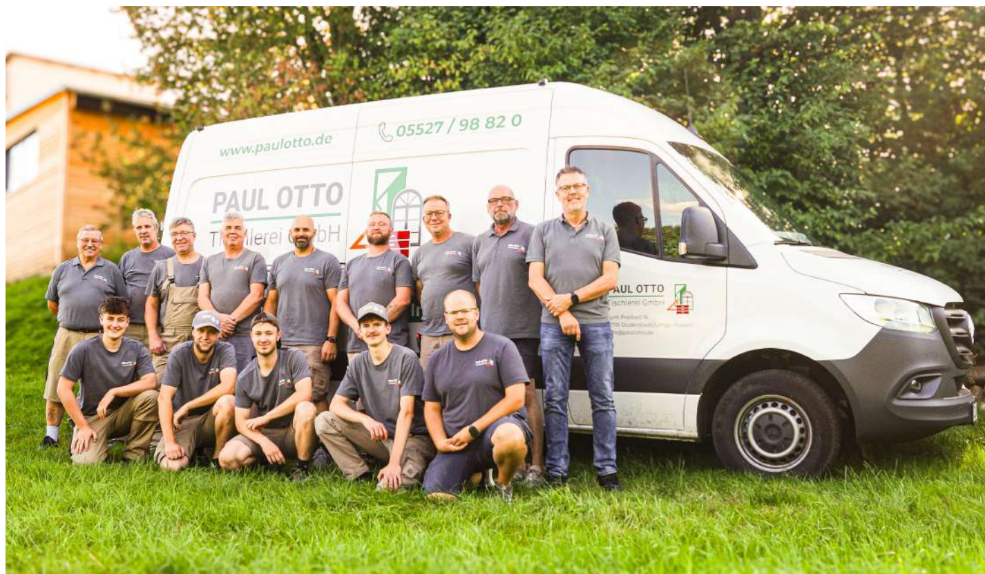
Bereits früh morgens für Sie auf den Beinen: Das Team der Paul Otto Tischlerei in Langenhagen.

Möbel, Küchen, Treppen, Fenster oder Spezialanfertigungen - die Paul Otto Tischlerei in Langenhagen steht für Handwerk „at his best“