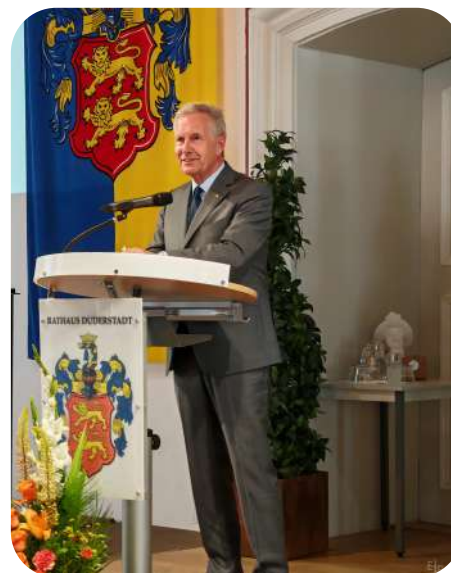
Bundespräsident a.D. Christian Wulff