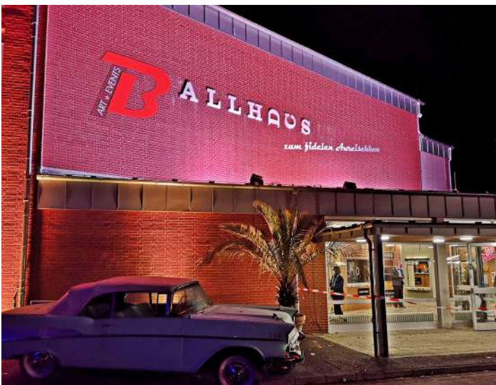
Platz für mehr als 700 Gäste: Das Ballhaus in Duderstadt

Tickets bei www.concerts.assconcerts.online-ticket.de und an bekannten Vorverkaufsstellen.