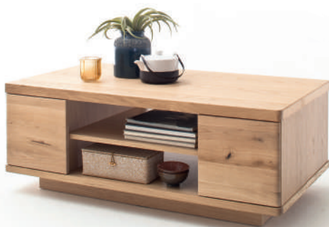
2 | Couchtisch