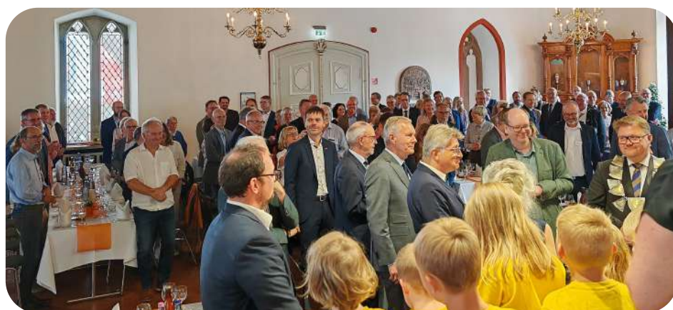
Zahlreiche Gäste kommen zum Empfang im Duderstädter Rathaus