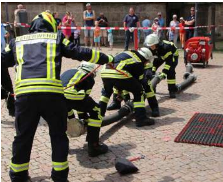
Leistungsvergleich in Duderstadt.