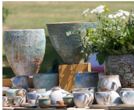
Kunsth Handwerk auf Gut Herbigshagen

Kulturveranstaltungen beim Deutschen Wandertag Der Deutsche Wandertag 2024 findet im Eichsfeld statt. Doch es wird nicht nur gewandert. Zahlreiche Kulturveranstaltungen präsentieren die Region auf vielfältige Weise. Angeboten werden Museumsführungen, Märkte, Städtetouren, Musik und Kunst, Vorträge, Dorffeste und vieles mehr. Das komplette Programm gibt es bei www.dwt2024.de .