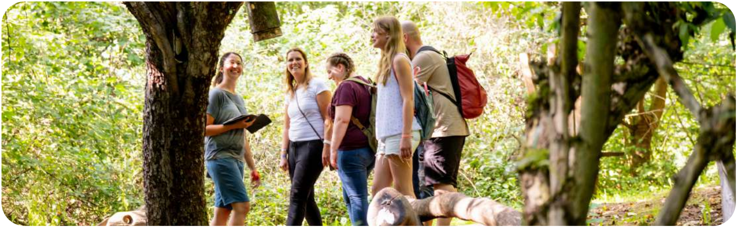
Kombinationstalente sind gefragt beim Outdoor Escape Game.

Die Natur hat die Kraft, uns zu verändern, aber auch wir verändern sie durch unsere Anwesenheit. Die verbleibenden naturnahen Flächen zu erhalten, sie zu schützen und in Teilen den Menschen zugänglich zu machen – das ist eine große Anforderung an unsere Gesellschaft und eine Chance zugleich.“