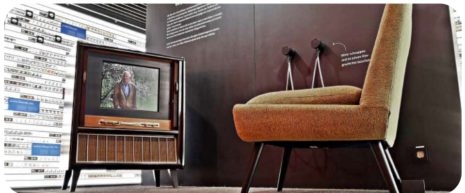
Ein Leben für den Film – Einblicke ins Sielmann-Archiv

Weitere Infos bei www.sielmann-stiftung.de .