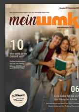
bei Gewinnspielen ist der Rechtsweg ausgeschlossen.