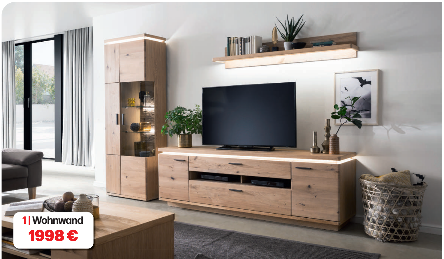
1 | Wohnwand 1998 €