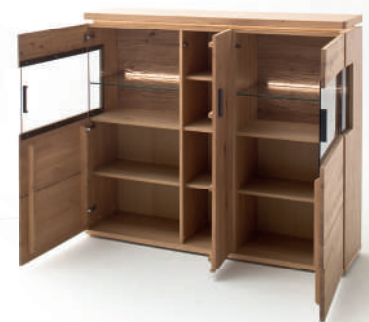
4 | Highboard