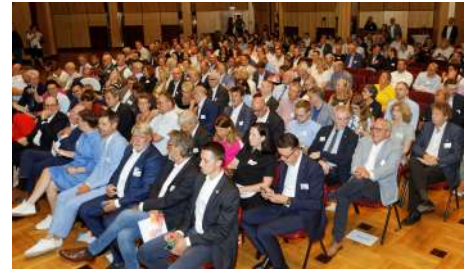
Rund 220 Gäste waren der Einladung der SüdniedersachsenStiftung in die Stadthalle Northeim gefolgt.