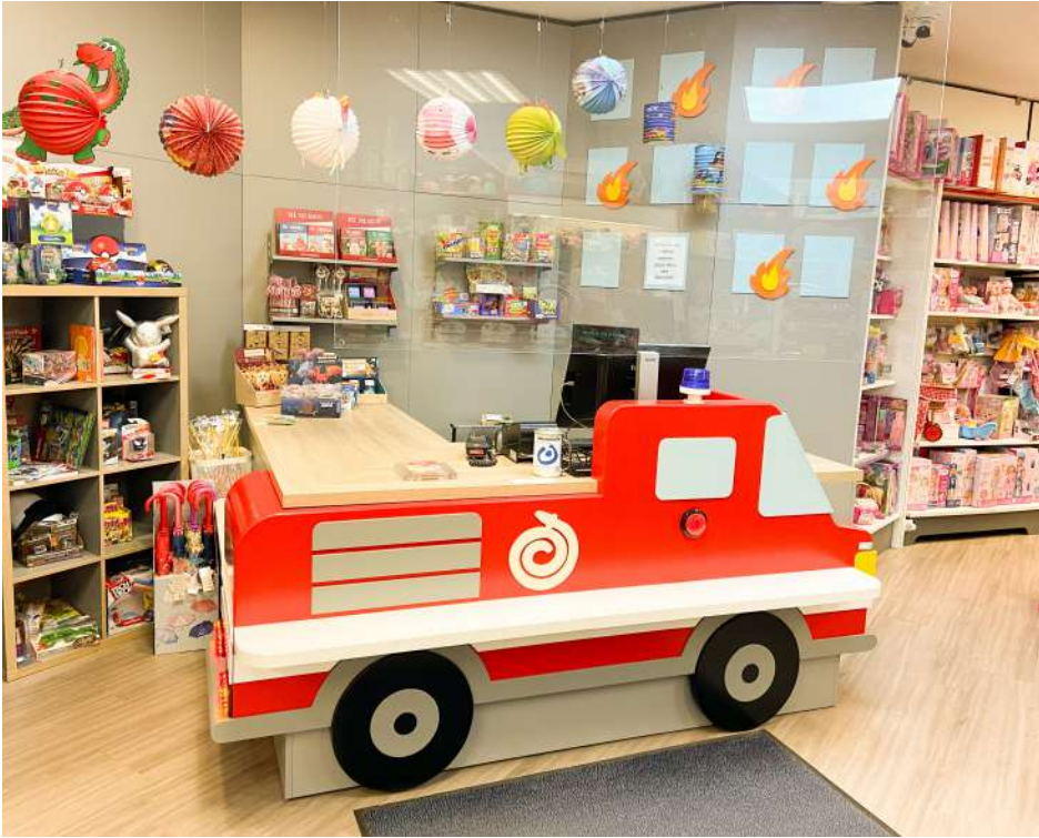
Individuell geplante Möbel aus der Hand des Fachmanns.