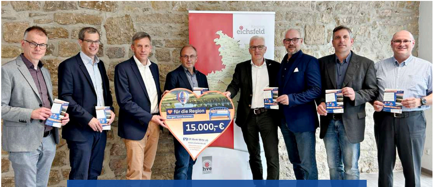
Startschuss Eichsfelder Schulpreis.

Projekt zur Förderung von regionalem Wissen