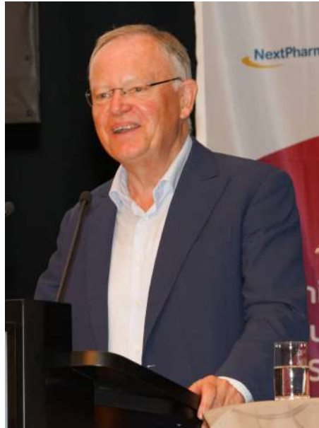
Niedersachsens Ministerpräsident Stephan Weil hielt die Festrede.