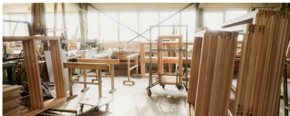
Blick in die Werkstatt der Paul Otto Tischlerei.

„Wir haben uns als komplette Tischlerei im Markt positioniert. Dabei bieten wir