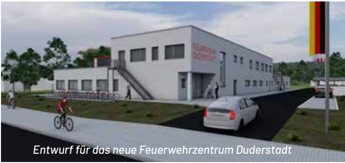
Entwurf für das neue Feuerwehrzentrum Duderstadt

Grafik: Ernst Rode Bau GmbH & Co. Betriebs KG