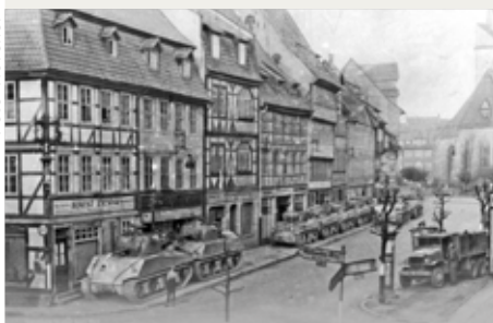
Amerikanische Panzer in der Duderstädter Marktstraße, April 1945.