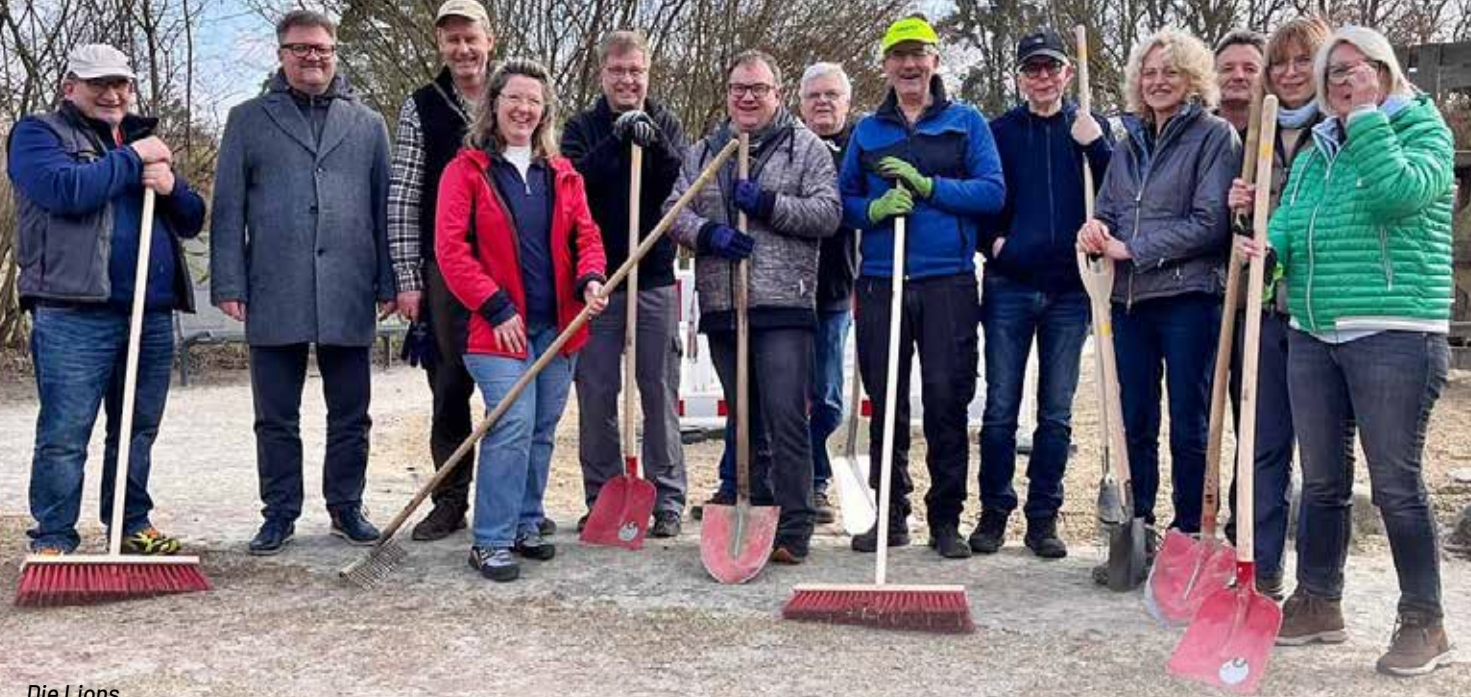
Die Lions bei der Pflegeaktion im LNS-Park.