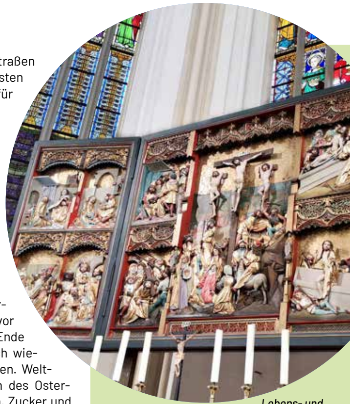
Lebens- und Leidensgeschichte Jesu im Altarraum der Basilika St. Cyriakus in Duderstadt.

Dennoch besinnen sich gerade in Zeiten, wo alles immer verfügbar sein muss, viele Menschen wieder auf die Wertschätzung der Natur und den nachhaltigen Umgang mit Ressourcen. Fasten ist nicht mehr unbedingt an eine Religion gebunden, und der temporäre „Rückzug“ aus Konsum und Schlemmerei erfährt mancherorts eine Renaissance. Somit kann die Osterzeit auch heute noch dazu beitragen, mit Dankbarkeit auf das zu blicken, was wir haben – und vielleicht auch etwas abzugeben und mit anderen zu teilen.