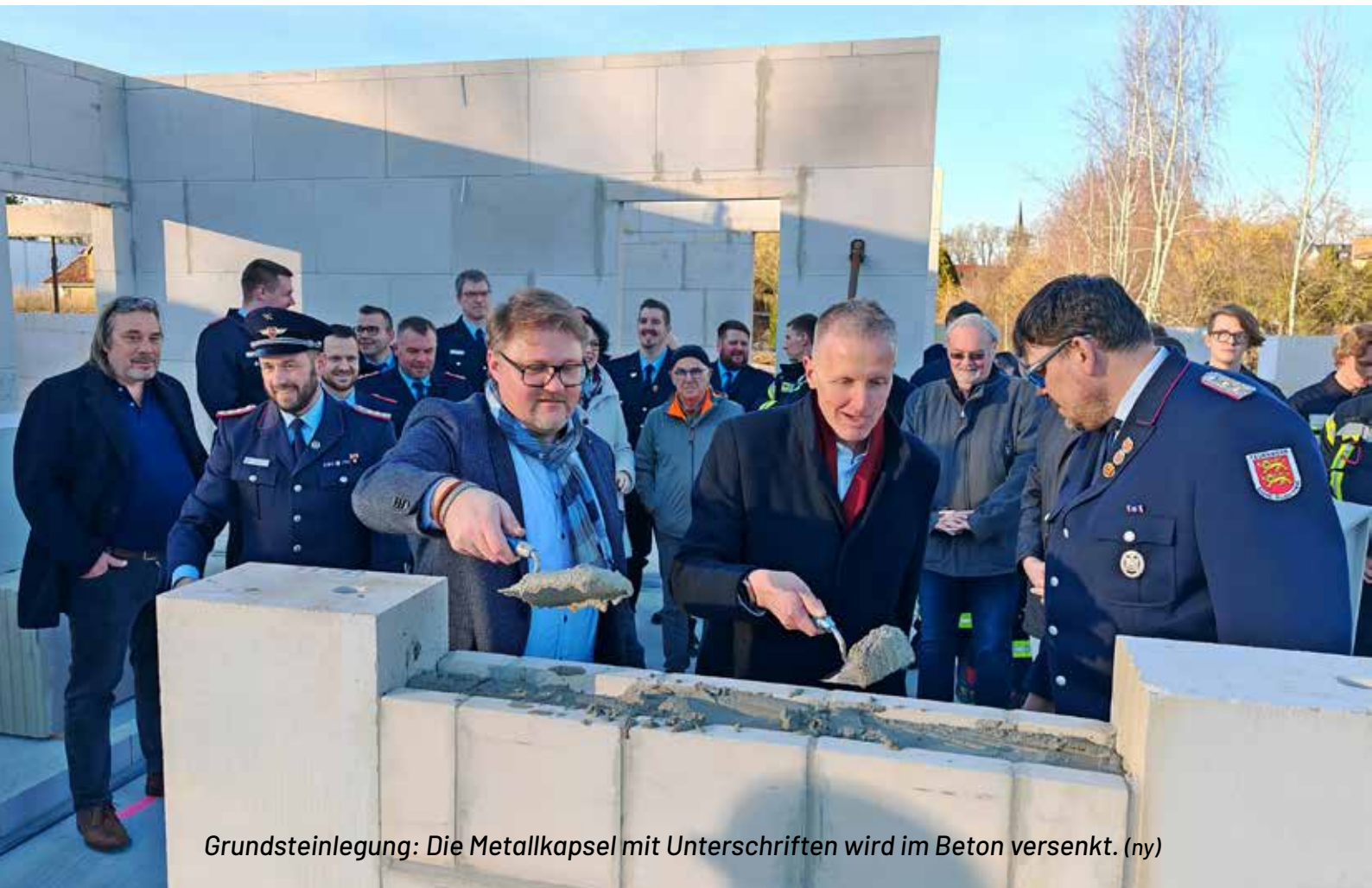
Grundsteinlegung: Die Metallkapsel mit Unterschriften wird im Beton versenkt. (ny)