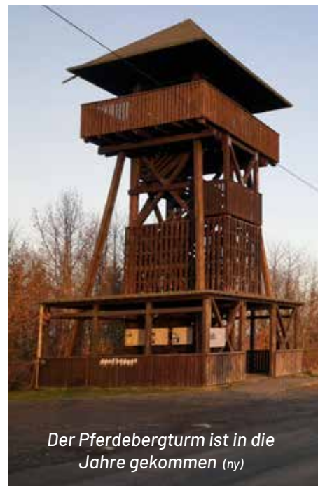
Der Pferdebergturm ist in die Jahre gekommen (ny)

So steht der Pferdebergturm für alle Besucher, Wanderer und Radfahrer mit seiner Aussicht über das ehemalige Sperrgebiet als Wahrzeichen der Freiheit und Einheit. ny/red