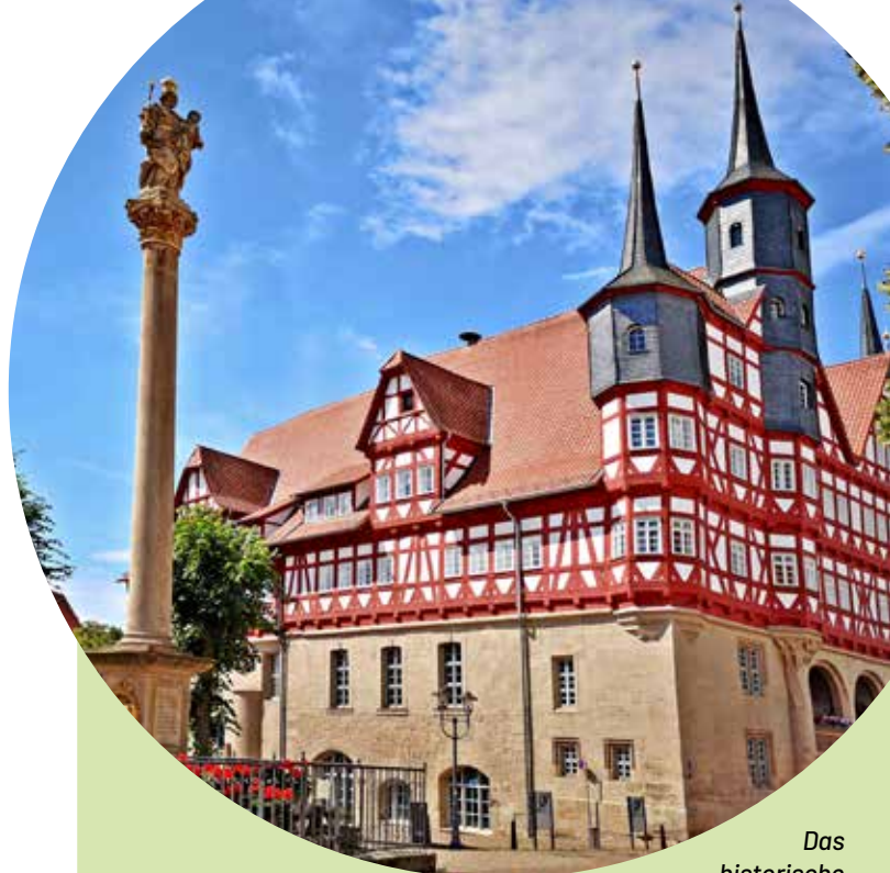
Das historische Rathaus in Duderstadt. (ny)

Auch das Lamm, Symbol für Reinheit und Unschuld, hatte schon seit der Antike in vielen Kulturen einen besonderen