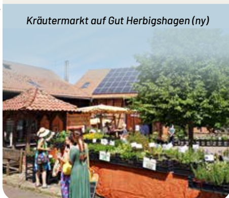
Kräutermarkt auf Gut Herbigshagen (ny)