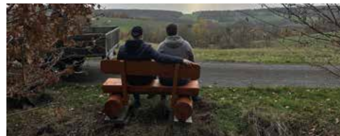
Aus Escherode, für Escherode: Über die Dorfmoderator*innen beantragt – als Sitzbank schnell umgesetzt.

Sie haben eine Idee, die Ihr Dorf oder Ihren Stadtteil voranbringt? Ob Bank am Spielplatz, Aktionstag im Stadtteil oder digitales Nachbarschaftsnetzwerk: Mit dem Dorf- und Quartiersbudget unterstützen wir als Landkreis Göttingen Ihr Engagement dort, wo es zählt – direkt vor Ort, schnell und unbürokratisch. Dafür stellt der Kreistag jährlich 40.000 Euro bereit. Im Dorfbudget können kleinere Vorhaben in den Dörfern mit bis zu 500 Euro je Dorf gefördert werden. Für Stadtteile in den Grund- und Mittelzentren gibt es zusätzlich das Quartiersbudget: Insgesamt stehen hier 20 Budgets à 500 Euro be-