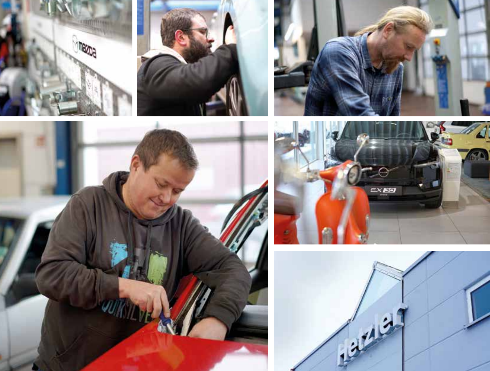
Einblick in die Werkstatt von Hetzler Automobile in Göttingen-Grone, Hans-Böckler-Straße 29.