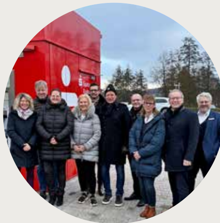
Das Team der Sparkasse und das Team der Bäckerei Hermann bei der Einweihung des neuen Geldautomaten

Die Sparkasse Duderstadt hat im Gewerbegebiet Gieboldehausen – auf dem Parkplatz der Bäckerei Hermann an der B27 – einen neuen barrierefreien Geldautomaten in Betrieb genommen. Damit wird ein weiterer Beitrag zur finanziellen Nahversorgung im ländlichen Raum geleistet und Service für Gewerbetreibende, Mitarbeitende, Gäste, Pendler, Lieferdienste und Anwohner geboten. Die Sparkasse Duderstadt und die VR-Bank Mitte arbeiten bei der Bargeldversorgung in der Region zusammen, um die Kosten der Infrastruktur möglichst gering zu halten, mehr Standorte