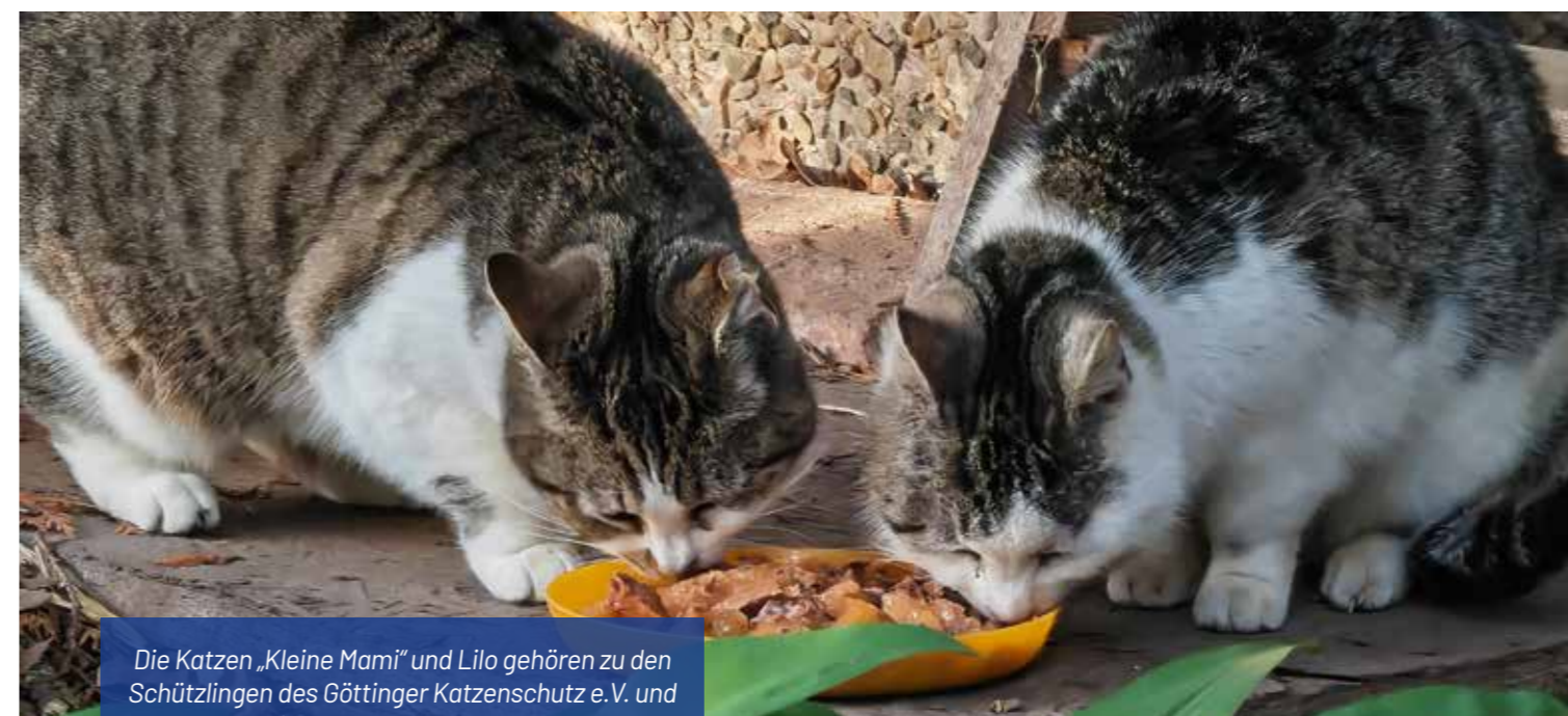
Die Katzen „Kleine Mami“ und Lilo gehören zu den Schützlingen des Göttinger Katzenschutz e.V. und werden im LNS-Park betreut

Gründe für die Katzenpopulation, für die sich niemand außer ein paar Ehrenamtliche verantwortlich fühlt. Die Tiere werden gefüttert und auch gesundheitlich versorgt – von der Wurmkur bis zur Kastration. Seit 2020 nimmt der Göttinger Katzenschutz an den jährlich vom Land Niedersachsen und der Tierärztekammer Niedersachsen initiierten und finanzierten Kastrationsprogrammen teil.