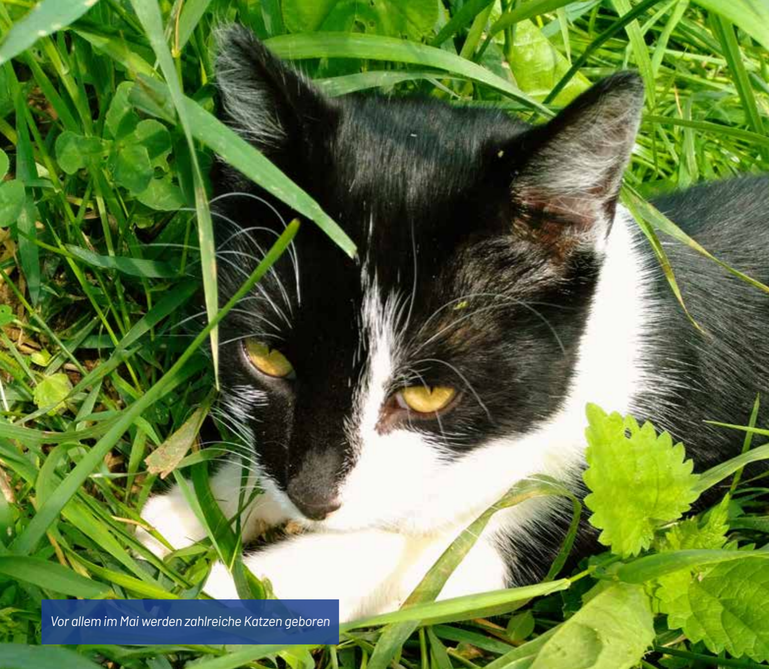
Vor allem im Mai werden zahlreiche Katzen geboren