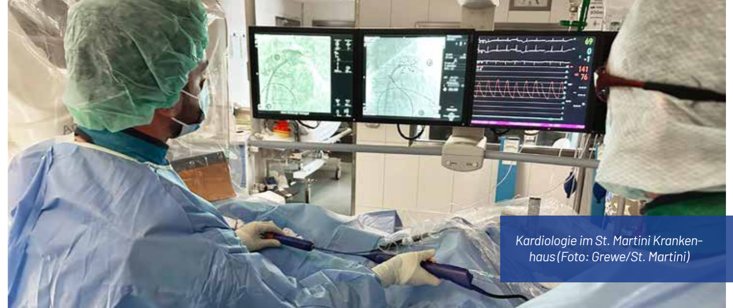
Kardiologie im St. Martini Krankenhaus

„Gerade für Menschen mit komplexen Herzimplantaten sind regelmäßige Kontrollen unerlässlich und sollten möglichst dort stattfinden, wo auch die