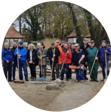
Die Mitglieder des Lions Club Duderstadt beim Frühjahrsputz im LNS-Park

Mit Harken, Schaufeln und Schubkarren kamen die Duderstädter Löwen in den LNS-Park und machten sich daran, den Müll einzusammeln. Büsche und Sträucher wurden fachgerecht zurückgeschnitten. Außerdem wurde