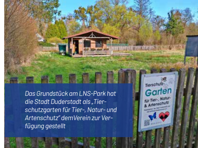
Das Grundstück am LNS-Park hat die Stadt Duderstadt als „Tierschutzgarten für Tier-, Natur- und Artenschutz“ dem Verein zur Verfügung gestellt