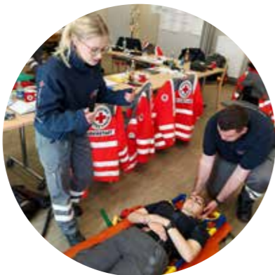
Übungen zur Sanitätsausbildung im Duderstädter DRK-Zentrum