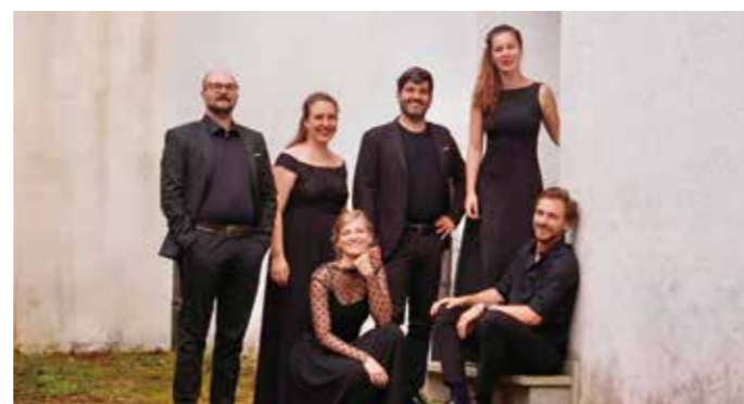
Vokalensemble Tempera Mente.

Mo 25.5., 17:00 Uhr, St. Norbert-Kirche, Friedland