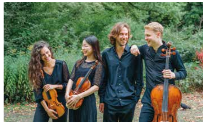
Ensemble Il Parrasio.

Do 21.5., 19:30 Uhr, Rathaus, Duderstadt