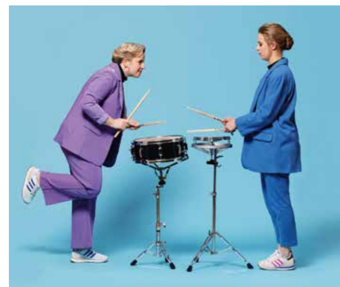
Porter Percussion Duo.

Do 7.5., 11:00 Uhr, Am Dorfgemeinschaftshaus, Landolfshausen Do 7.5., 15:30 Uhr, Kirchplatz, Hann. Münden Fr 8.5., 10:00 Uhr, Marktplatz 30, Herzberg am Harz Fr 8.5., 12:00 Uhr, Marktstraße 43, Duderstadt