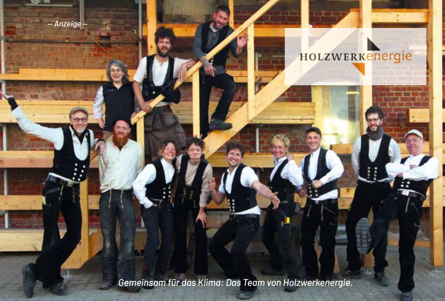
Gemeinsam für das Klima: Das Team von Holzwerkenergie.