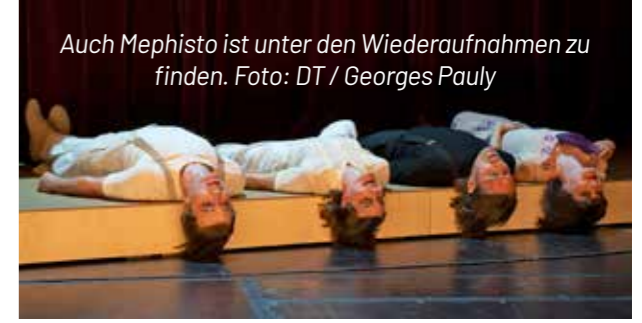
Auch Mephisto ist unter den Wiederaufnahmen zu finden.