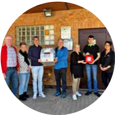
Übergabe des Defibrillators am Fuhrbacher Schützenhaus

D er Vorstand des Schützenvereins Geselligkeit Fuhrbach e.V. 1912 wollte zur besseren Notfallversorgung einen Defibrillator am Schützenhaus in Fuhrbach anbringen. Durch die Aktion der VR Bank „Wir tun Gutes“ konnte dieser Wunsch in Erfüllung gehen.