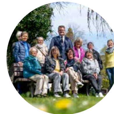
Mitglieder des Hospizvereins und Bürgermeister Thorsten Feike bei der Begegnungsbank auf dem Friedhof

D er Hospizverein Eichsfeld bietet Erneut Gespräche auf der „Begegnungsbank“ unter der Traueresche auf dem Duderstädter Friedhof St. Paulus an. Trauernde können bei einer Ansprechpartnerin aus dem Hospizverein Trost finden. Die Termine finden Interessierte auf den Aushängen an den Friedhofseingängen. Das Angebot ist kostenfrei und ohne Anmeldung möglich. Zum Auftakt traf sich Bürgermeister Thorsten Feike mit Mitgliedern des Hospizvereins direkt vor Ort. Er dankte den Ehrenamtlichen für ihr Engagement