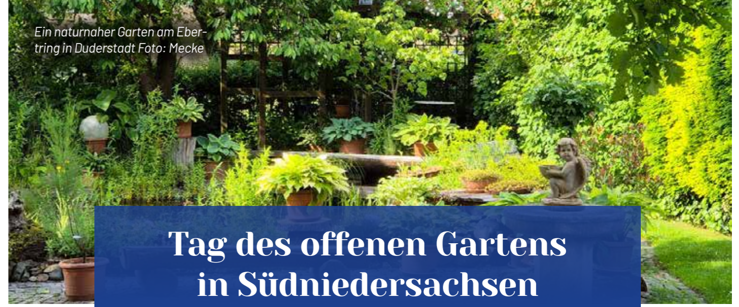
Ein naturnaher Garten am Ebertring in Duderstadt

Tag des offenen Gartens in Südniedersachsen Zahlreiche private Gärten in der Region können besichtigt werden