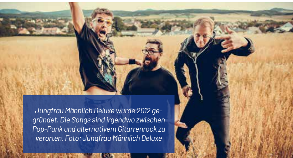
Jungfrau Männlich Deluxe wurde 2012 gegründet. Die Songs sind irgendwo zwischen Pop-Punk und alternativem Gitarrenrock zu verorten.