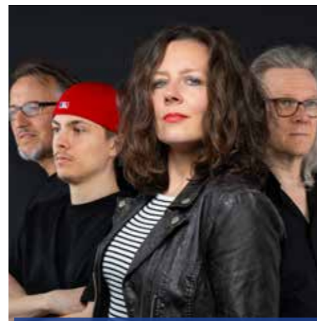
DOGS ON LEAD machen puren und harten Rock – von eigenen Songs bis zu mitreißenden Versionen von Heart, Led Zeppelin, Skunk Anansie, Metallica und mehr.