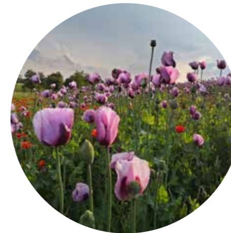
Pinkfarbener Schlafmohn wird auch im Eichsfeld angebaut (ny)

Die Tiere sind sehr zutraulich und werden auch zu Therapiezwecken eingesetzt. Zum Mittagessen kehrt die Reisegruppe in Pfaffschwende ein. Gut gestärkt lässt sich anschließend die Planwagenfahrt durch die pinkfarbene Mohnblüte in Germerode genießen.