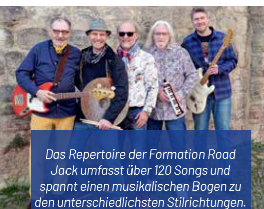
Das Repertoire der Formation Road Jack umfasst über 120 Songs und spannt einen musikalischen Bogen zu den unterschiedlichsten Stilrichtungen.