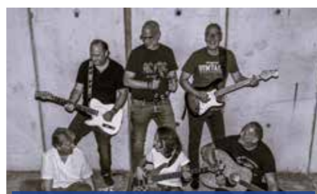
Rock Seven ist seit vielen Jahren eine in Mittel- und Norddeutschland regional gefragte Cover-Band für hohe musikalische Ansprüche.