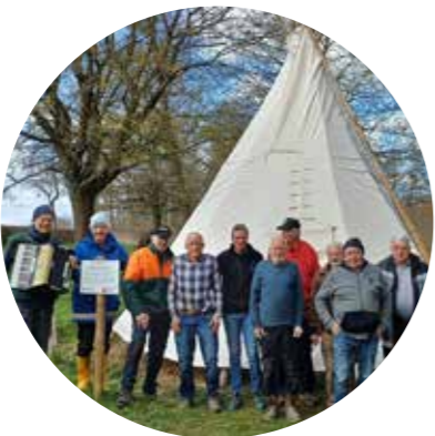
Ehrenamtliches Engagement in Mingerode

D as Tipi auf dem Grillplatz Mingerode konnte durch die Unterstützung der VR Bank Mitte eG erneuert werden. Die Mitglieder von Mingerode 2030 und der Rentnergruppe haben selbst Hand angelegt, um das neue Tipi aufzustellen. Das bisherige hatte stark unter der Witterung gelitten. Der Grillplatz ist eine Station auf dem Streuobstwanderweg zwischen Duderstadt und Mingerode, der vom Deutschen Wanderverband als Qualitätsweg ausgezeichnet wurde. Auf Informationstafeln wird