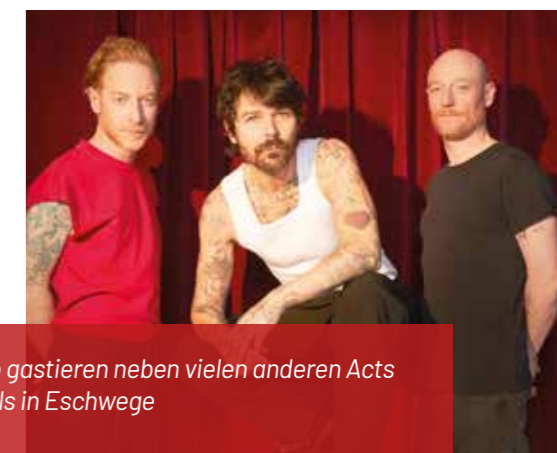
Bosse und die Band Biffy Clyro gastieren neben vielen anderen Acts ebenfalls in Eschwege