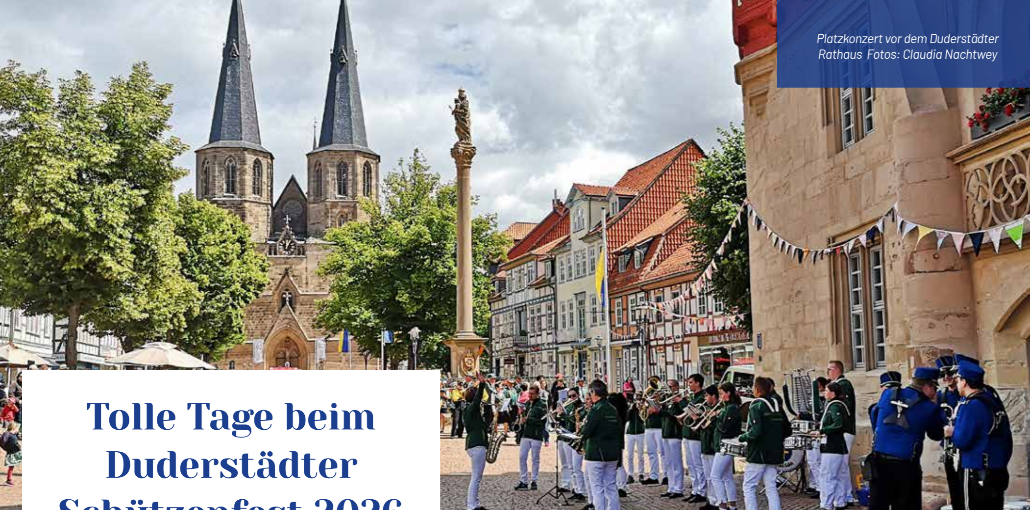
Platzkonzert vor dem Duderstädter Rathaus