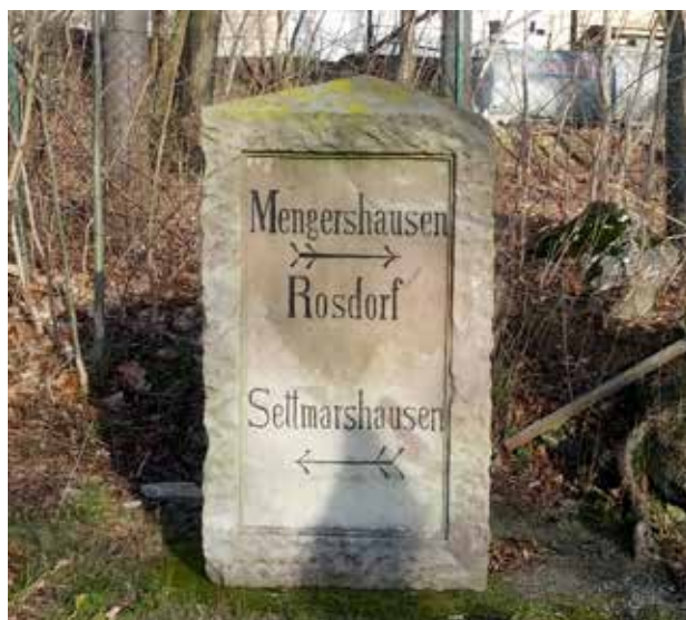
Ein Projekt der Bürgerstiftung: Das Restaurieren des alten Wegweisers zwischen Rosdorf und Settmarshausen.

Göttinger Str. 37 • 37124 Rosdorf Tel.: 05 51 / 5 04 13 43