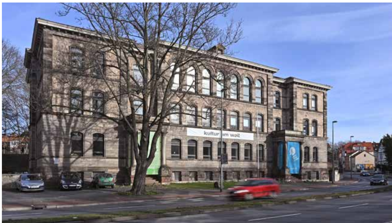
Die ehemalige Voigtschule ist aktueller Standort des Schauspielhauses.