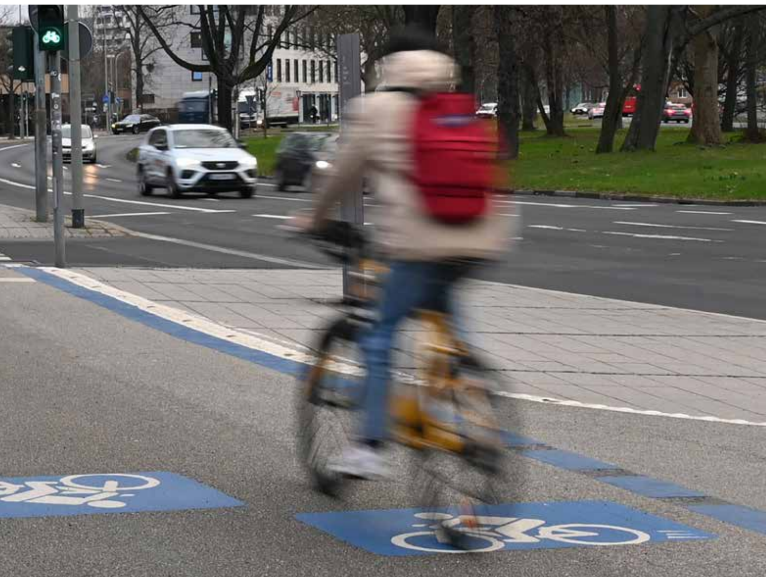
Die Mobilität spielt eine große Rolle im Klimaplan Göttingen 2030. Ein Radschnellweg führt durch die Stadt vorbei am Bahnhof. Laut Klimaplan zeige die Verkehrsmittelwahl der Göttinger Bevölkerung eine „positive Entwicklung“: Mehr als die Hälfte der Wege (53 Prozent) würden mit dem Fahrrad zurückgelegt, bei steigender Tendenz.

gen, könne Klimaschutz gelingen. Göttingen biete, so Epperlein, aufgrund seiner langen Klimaschutz-Tradition, der sehr engagierten Bürgerschaft sowie der innovativen Forschungs- und Unternehmenslandschaft beste Voraussetzungen, um beim Klimaschutz Vorreiter zu sein. Im März wird die EU-Kommission die etwa 100 europäischen Städte für das Programm auswählen.