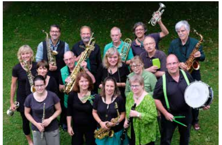
Musikprojekte der Rosdorfer Bürgerstiftung haben die Bigband „TripleB“ hervorgebracht.