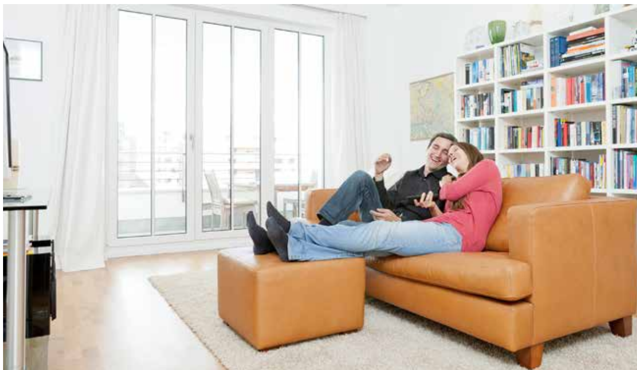
Einrichtung unterdrückt Geräusche. Daher sind große Regalwände in hellhörigen Wohnungen eine gute Idee.