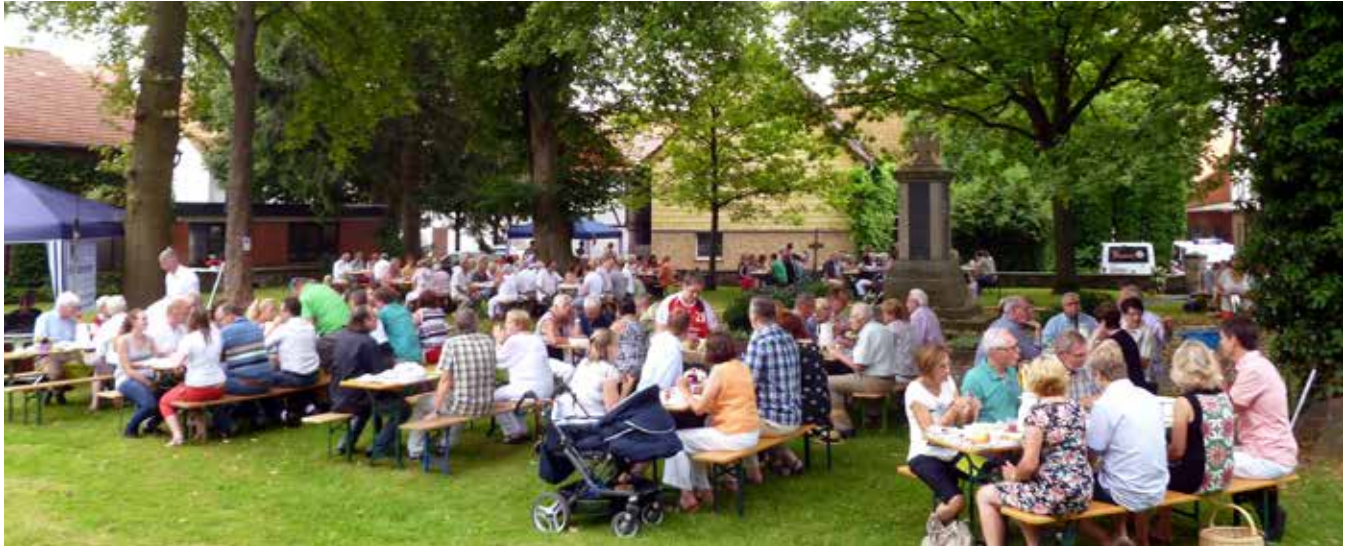
Das jährlich stattfindende Bürgerfrühstück wird gemeinsam mit der Werbegemeinschaft Rosdorf veranstaltet. Man freut sich darauf, am 3. Juli wieder im Freibad frühstücken zu können.