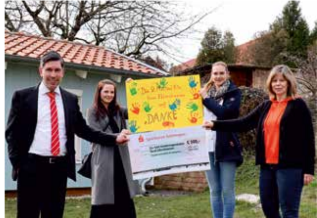
Gegen Corona – für unsere Kinder. Übergabe an den Kindergarten Groß Ellershausen.

Die Sparkasse erhält auch 2021 eine Vielzahl an Auszeichnungen. Bereits zum fünften Mal in Folge ist die Sparkasse Göttingen im vergangenen Jahr als beste