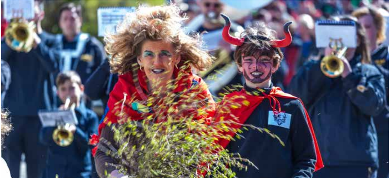
Die Besucher erwartet ein fantastisches Programm mit höllisch guter Live-Musik.

Rendezvous mit Hexen und Teufeln am 30. April