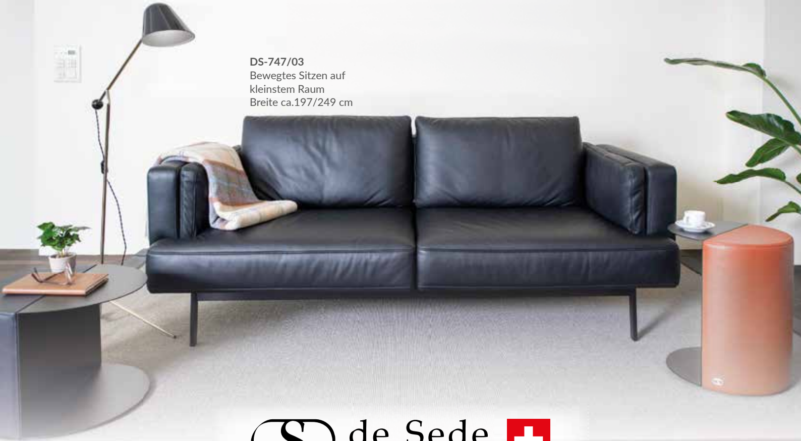
DS-747/03 Bewegtes Sitzen auf kleinstem Raum Breite ca.197/249 cm