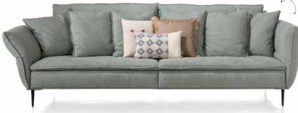
4-Sitzer Marseille (Breite 295cm, inklusive Rückenkissen, ohne Dekokissen) ab 1899,- wie abgebildet in Stoff Monta 2299,- | in verschiedenen Ausführungen erhältlich Standard Sitzkomfort Polyetherschaum | Bücherregal 1099,-