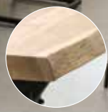
Mit natürlicher Baumkante

Top Kauf Tisch Living ab 1149,- (180x90/100cm, Preise ohne Deko)