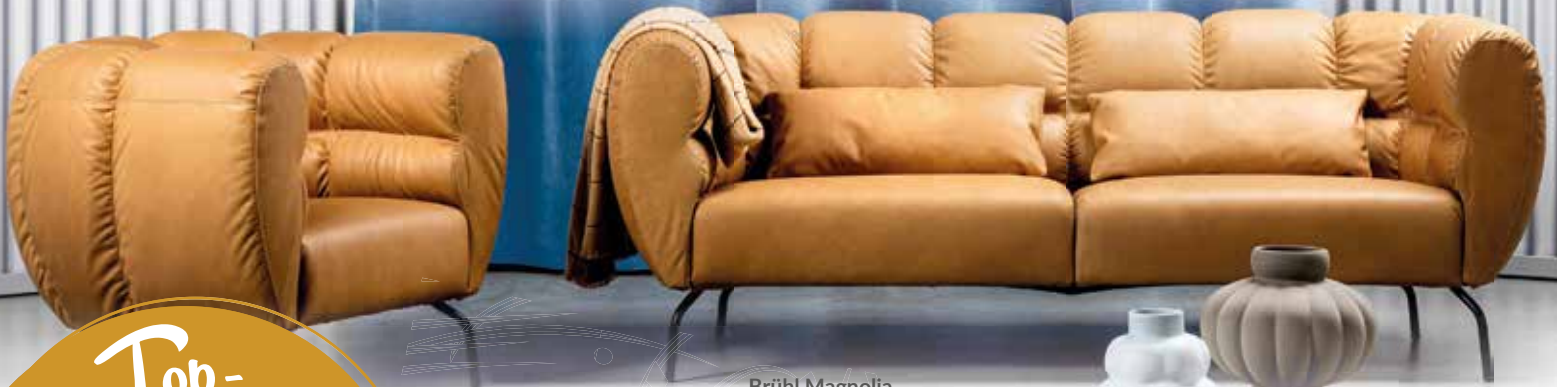
Brühl Magnolia Sofa + Sessel Reddot Winner 2022