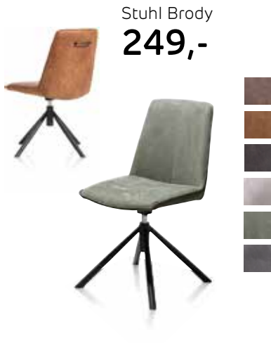
Stuhl Brody 249,-