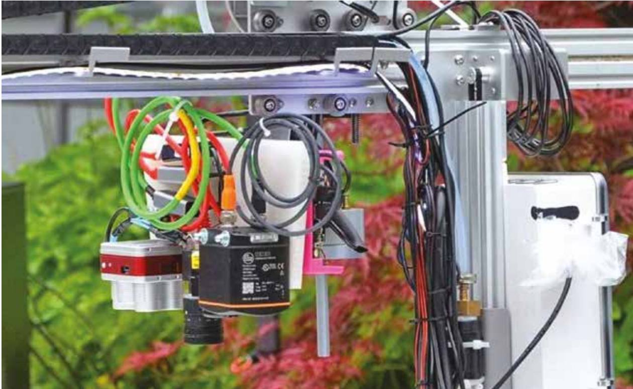
PRO-MAPPER erkennen später nicht nur Bei- und Unkräuter, sondern auch krankhafte Veränderungen der Gewächse.

Forschungsprojekt an der Göttinger Hochschule für angewandte Wissenschaft und Kunst (HAWK)