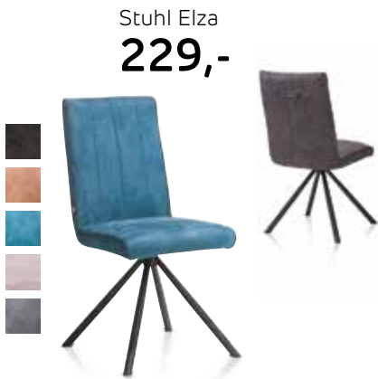
Stuhl Elza 229,-