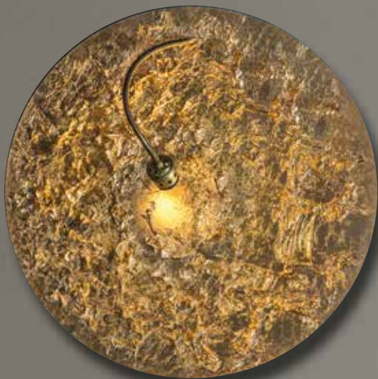
Wandleuchte Luna Piena blattsilber/blattgold, D: 80cm, LED 1x7,5 Watt, dimmbar