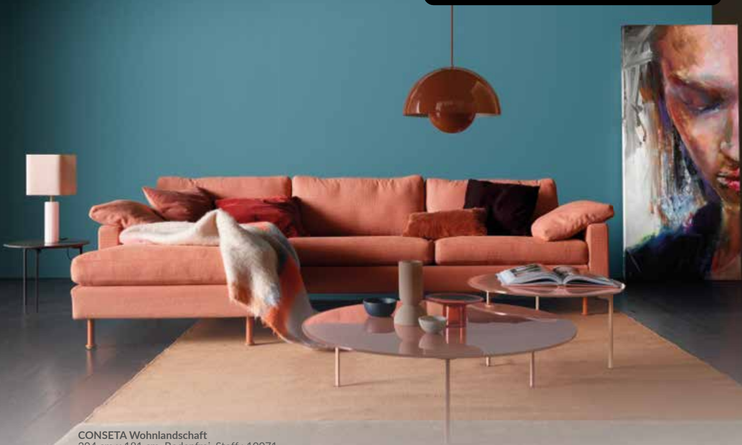
CONSETA Wohnlandschaft 294 cm x 181 cm, Bodenfrei, Stoff : 10071 Grapefruit Dieses neue Liegeelement mit 120 cm Kissenbreite ist der beste Platz, um mit Lieblingsmenschen bequem zu lümmeln und zu fläzen.