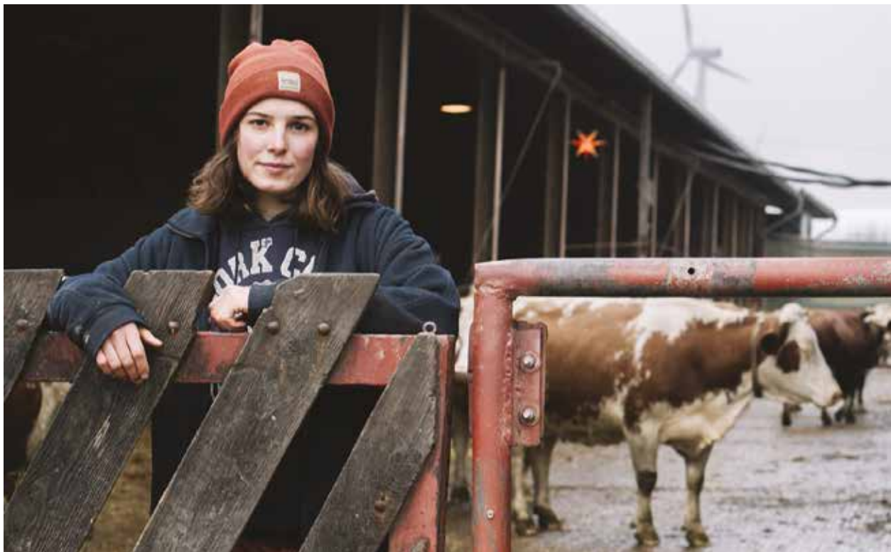
Ein Forschungsprojekt gibt Einblicke in die Lebenssituation von Frauen auf landwirtschaftlichen Betrieben.

Göttinger Forschungsprojekt beleuchtet die Lebenssituation von Frauen in landwirtschaftlichen Betrieben in Deutschland