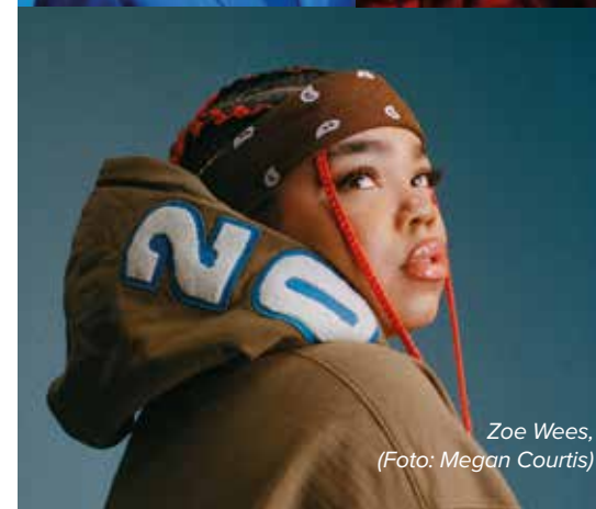
Zoe Wees