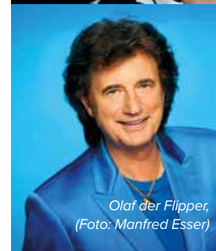
Olaf der Flipper