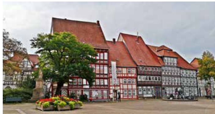
Fachwerk in der Duderstädter Marktstraße

Die Website www.wohnraum5eck.de bietet neben guten Sanierungsbeispielen verschiedene Informationsbereiche zu Fördermitteln, Steuererleichterungen, Tipps für den Hauskauf und zum Brandschutz, Ansprechpersonen in den Behörden, aktive Bürgergruppen für den Austausch zu Sanierungs- und Innenstadtbelebungsthemen und vieles mehr.