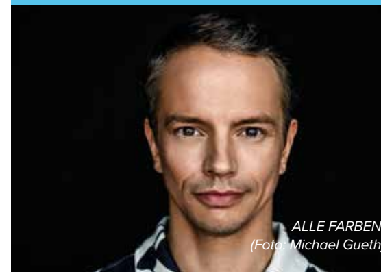
ALLE FARBEN, (Foto: Michael Gueth)