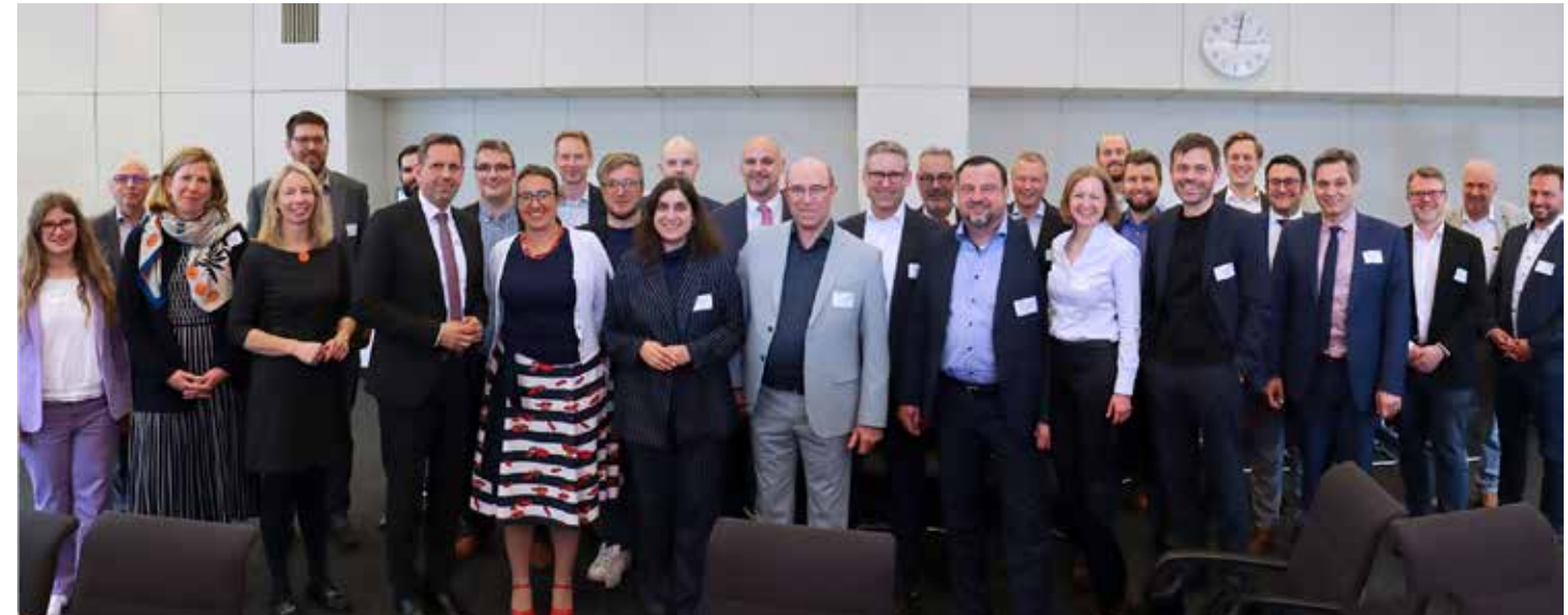
Rund 30 Personen waren zum Austausch der Wasserstoff-Allianz Südniedersachsen im Niedersächsischen Landtag zusammengekommen – darunter der Niedersächsische Wirtschaftsminister Olaf Lies (7.v.li.).