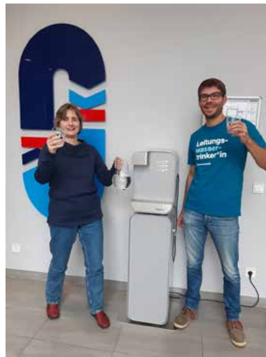
Leitungswasser zapfen statt Flaschenwasser kaufen – der Wasserverband ist Partner des Projekts Wasserwende – und als leitungswasserfreundliches Unternehmen ausgezeichnet.