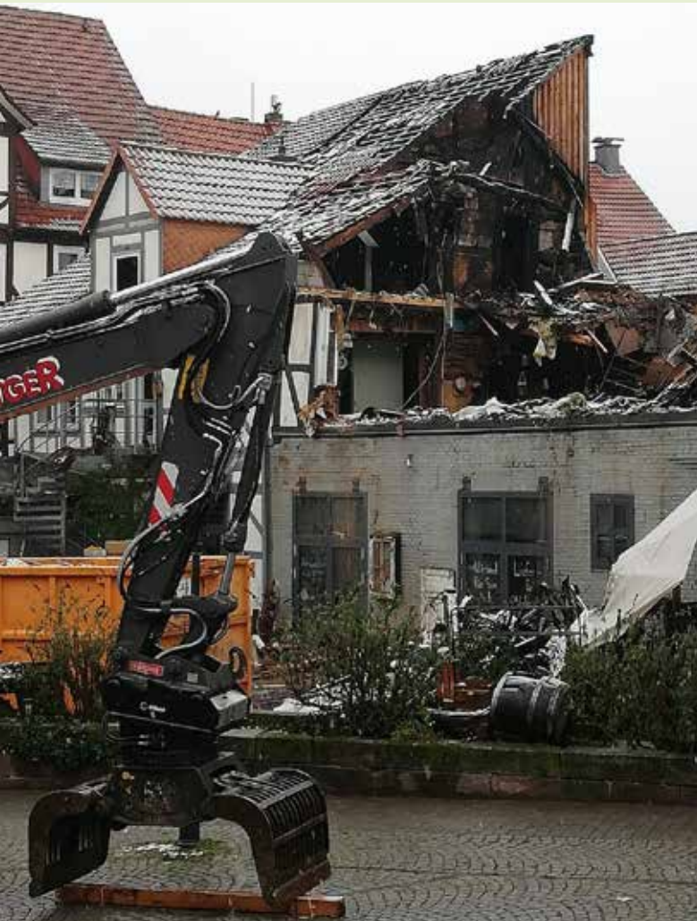
Der Schaden durch die Brände ist hoch, einige Häuser mussten abgerissen werden.

Es war der Abend des 6. Novembers 2020 als ganz Hann. Münden gebannt auf die Altstadt schaute. Denn hier stand ein Ladengeschäft in Flammen und das Feuer zerstörte nicht nur das Haus, in dem es ausgebrochen war, sondern auch mehrere umliegende Häuser. Durch die enge Bebauung der Innenstadt mit Fachwerkhäusern waren die Flammen schnell auch auf die umliegenden Gebäude übersprungen und es entstand ein Schaden in Millionenhöhe. Lange war die Feuerwehr nicht nur mit der Brandbekämpfung beschäftigt, sondern auch die Abrissarbeiten in der Rosenstraße nahmen nicht nur viel Aufwand, sondern auch viel Zeit in Anspruch.