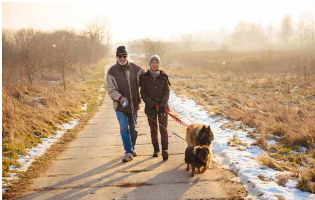
Der regelmäßige Spaziergang bringt nicht nur frische Luft, sondern auch ganz viel Bewegung, die immer wichtiger wird.

abhalten, uns vor die Tür zu wagen! Denn die frische Luft gibt uns einen richtigen Energiekick – und das auch ohne Sonne. Diese ist noch nicht kräftig genug, um die Vitamin-D-Produktion im Körper anzukurbeln. Aber die frische Luft sorgt trotzdem dafür, dass wir uns fit und bereit für einen produktiven Tag fühlen.