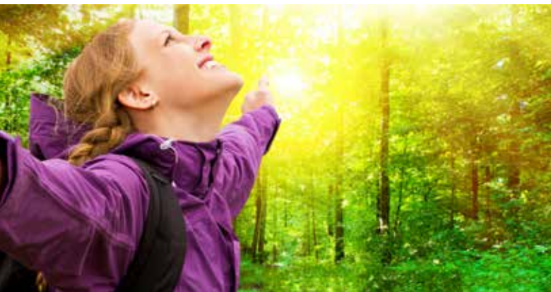
Wir alle freuen uns auf die Frühjahrs Sonne, doch ohne Schutz sollte niemand vor die Tür gehen.

M it dem einsetzenden Frühjahrs Wetter kommen nicht nur die wärmenden Temperaturen zurück und der Schnee verschwindet, auch die Sonne zeigt sich im Frühjahr endlich wieder von ihrer warmen Seite. Und so schön das für die Seele und das Glücksgefühl ist, so gefährlich kann das für die Haut und die Gesundheit werden!