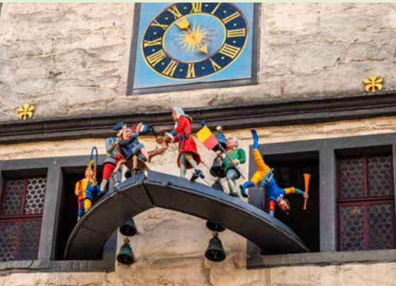
Dr. Eisenbarth findet an vielen Plätzen in Hann. Münden seinen Patz.

viele Wanderchirurgen wie Eisenbarth von einem Ort zum anderen zogen, um den eingesessenen Ärzten nicht zu viel Arbeit wegzunehmen.