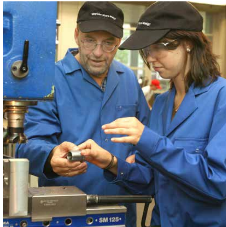
Eine Ausbildung im Handwerk sorgt nicht nur für Abwechslung im Beruf, sondern bildet auch für das Leben.

Die Kreishandwerkerschaft Südniedersachsen steht Schülern, die vor dem Abschluss stehen und gerne im Handwerk eine Ausbildung machen möchten immer mit offenen Armen zur Seite. Viele Informationen zu regionalen Unternehmensangeboten gibt es so unter www.handwerk37.de .