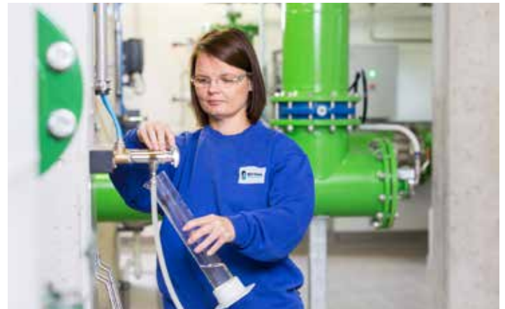
Wasser nachhaltig nutzen und Verluste gering halten – dafür engagiert sich der Wasserverband Peine.

Wasserversorger wie der Wasserverband Peine engagieren sich vor Ort. Mit ihren Investitionen in die Infrastruktur halten sie Wasserverluste gering. Der Verband aus Peine unterstützt zudem das Projekt Wasserwende: Hier wird bewusst auf Leitungs- statt Flaschenwasser gesetzt, um Plastikmüll zu vermeiden und CO2 einzusparen. Wie das geht, wird in 13 Wasser-Quartieren bundesweit gezeigt, eines davon ist in Peine. Mehr dazu www.wasserwende.org