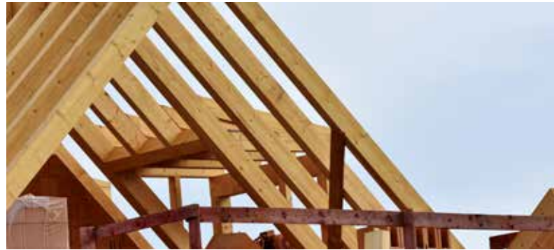
Noch bis Ende März können Häuslebauer von dem Förderantrag profitieren.

Für das Baukindergeld gibt es verschiedene Fristen die eingehalten werden müssen. Bis spätestens Ende März muss so der Kaufvertrag unterschrieben, oder der Bauantrag bewilligt sein – hier kommt einem sogar die Corona-Pandemie zu Gute! Denn eigentlich sollte die Frist mit dem Jahr 2020 enden, wurde wegen der Pandemie aber drei Monate verlängert. Neben dem Kaufvertrag braucht es aber noch mehr, denn der Antrag muss spätestens sechs Monate nach dem Einzug gestellt werden und kann bis zum 31.12.2023 gestellt werden.