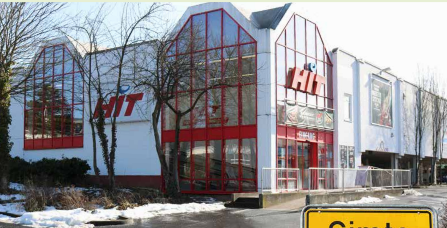
Der HIT-Markt in Gimte wird abgerissen und durch einen Neubau ersetzt werden.