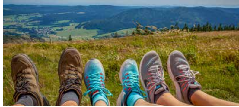
Mit der Familie einen Ausflug in die umliegende Natur zu machen kann nicht nur Entspannen, sondern auch lehrreich sein.

Aber nicht nur in Bursfelde gibt es viel zu entdecken, sondern auch am Blümer Berg. Die grüne Lunge Mündens sorgt mit Sicherheit dafür, dass man die Ruhe der Natur bis tief in die Knochen und in die Seele spüren kann - und dafür muss man gar nicht so weit laufen! Denn mit seiner Nähe zum Mündener Stadtgebiet ist der Blümer Berg nicht nur für Touristen eine tolle Idee, sondern auch für Mündener, die einen