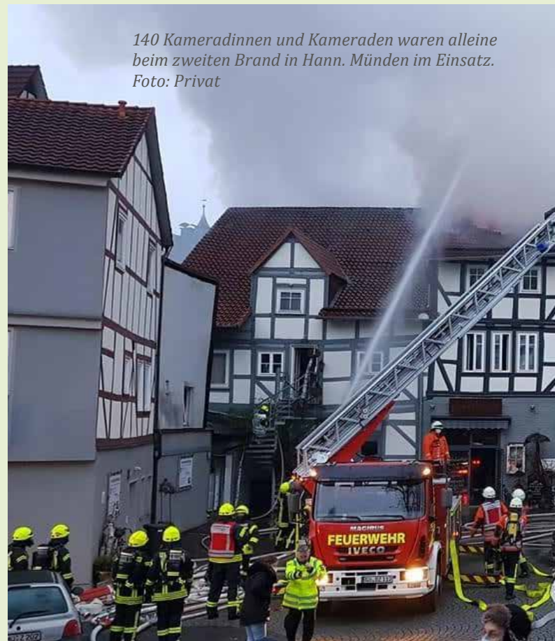
140 Kameradinnen und Kameraden waren alleine beim zweiten Brand in Hann. Münden im Einsatz.

Stundenlang mussten die Einsatzkräfte darum kämpfen, das Feuer unter Kontrolle bringen zu können und auch diesmal konnte nicht verhindert werden, dass mehrere Gebäude – darunter auch die Postscheune – schwer beschädigt wurden. Auch diesmal entstand ein großer Sachschaden von rund 500.000 Euro, die bisherigen polizeilichen Ermittlungen haben keine Anzeichen für ein Fremdverschulden ergeben. Für die Besitzer der Postscheune ist mit dem