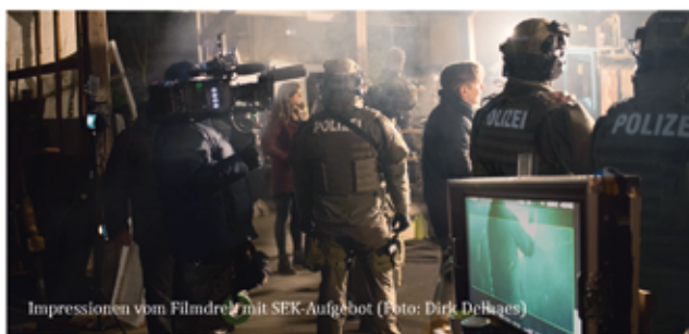
Impressionen vom Filmdreh mit SEK-Aufgebot

Zurzeit ist das Team um Regisseur Jakob Gisik in der Vorbereitung eines Promo-Teaser.