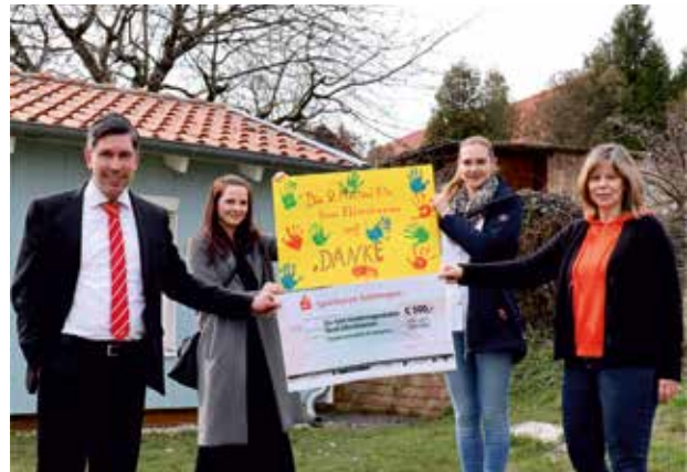
Gegen Corona – für unsere Kinder. Übergabe an den Kindergarten Groß Ellershausen.

Die Sparkasse erhält auch 2021 eine Vielzahl an Auszeichnungen. Bereits zum fünften Mal in Folge ist die Sparkasse Göttingen im vergangenen Jahr als beste