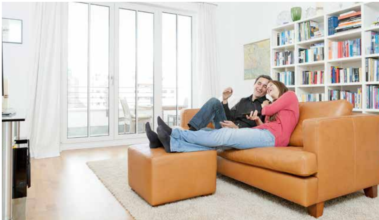
Einrichtung unterdrückt Geräusche. Daher sind große Regalwände in hellhörigen Wohnungen eine gute Idee.

S traßenlärm, Musikbeschallung aus der Nachbarwohnung, klappernde Absätze oder das Schleudern der Waschmaschine - es gibt viele nervige Geräusche im eigenen Zuhause. Doch für fast jedes Problem gibt es eine Lösung, die den Lärm zumindest verringert. Zunächst sollten Betroffene klären, wo der Schall entsteht und wie er in die Wohnung gelangt.