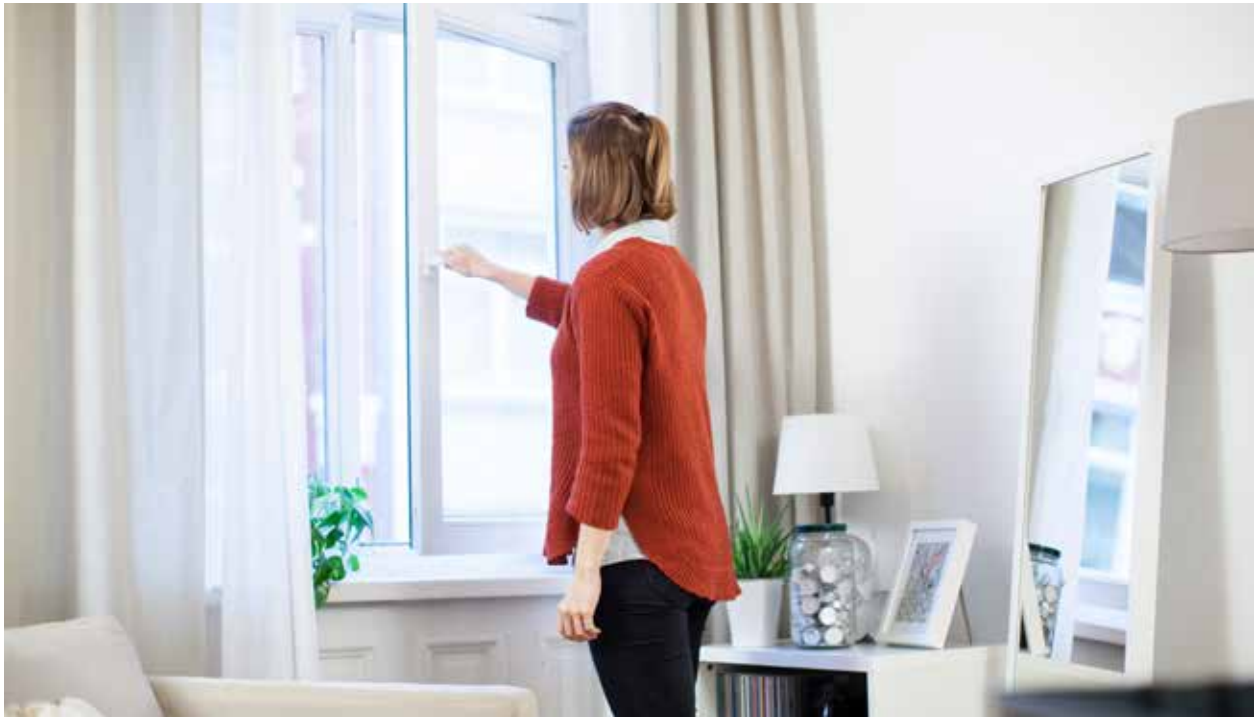
Kommt der Lärm von draußen, sind gute Fenster das A und O. Vor allem an stark befahrenen Straßen.

dann in der Nachbarwohnung gut zu hören. Es lohnt sich also, Geräte von der Wand abzurücken.