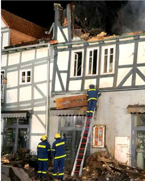
Im Januar 2021 leistete das THW Ortsverein Hann. Münden Hilfe.