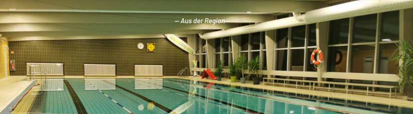
Das Hallenbad Reinhardshagen bietet Platz für Schwimmer, Vereine und Familien und ist ein wichtiger Ort für Sport, Freizeit und Schwimmunterricht in der Region.