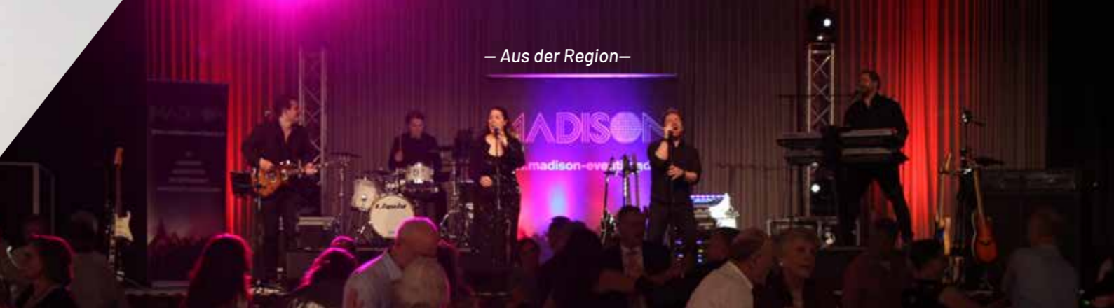
– Aus der Region –