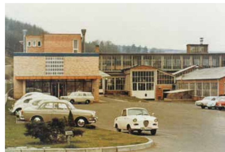
Engagement und Expertise: Seit vier Jahrzehnten steht das HTT-Team für Präzision und Qualität in der Transformatorentechnik.

HTT produziert leistungsstarke Transformatoren, die in verschiedensten Bereichen eingesetzt werden – von Industrie- und Energieversorgungsunternehmen über den Maschinenbau bis hin zu spezialisierten Hochspannungstechnologien. Das Unternehmen setzt dabei konsequent auf den Standort Deutschland: Alle Produkte werden in Hann. Münden entwickelt und gefertigt. Dadurch garantiert HTT höchste Verarbeitungsqualität und eine strenge Endkontrolle, was das Unternehmen zu einem geschätzten Partner für Kunden weltweit macht.