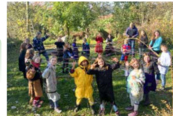
Kreative Ferien auf dem Resthof

Die Workshops richten sich an Kinder zwischen 7 und 12 Jahren. Anmeldungen sind ab sofort möglich. Weitere Informationen und Anmeldung per E-Mail unter info@misch-kulturen.de oder telefonisch: 05542 72812.