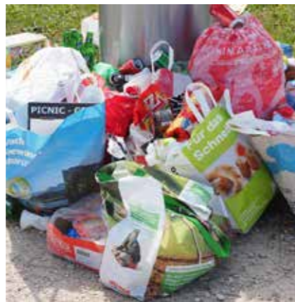
Bürger, Vereine und Initiativen setzen gemeinsam ein Zeichen für eine lebenswerte Stadt.