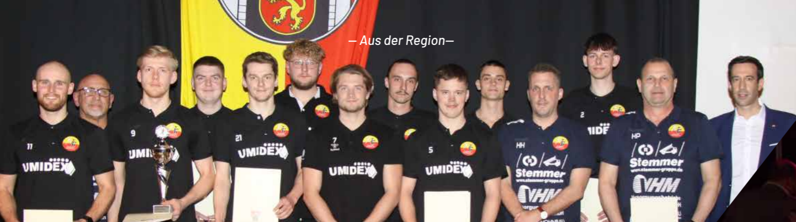
– Aus der Region –