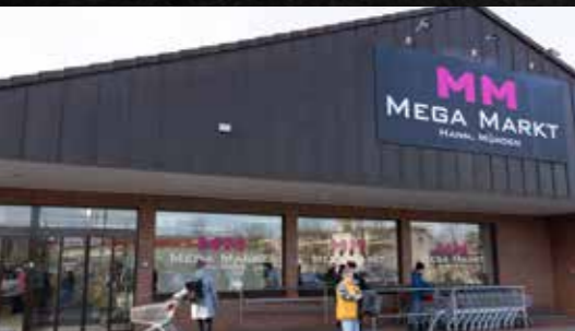
Auf über 1000 m 2 bietet der Mega Markt ein breites Spektrum an Gemischtwaren und Sonderposten.

Mega Markt Hann. Münden feierte Eröffnung