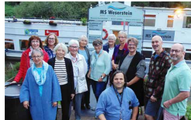
Treffen einiger Vorleserinnen und Vorleser zum Abschluss der Lesereihe im Herbst 2024.

Zur Vorlesepraxis in den Familien zeigt die Studie der Stiftung Lesen für das Jahr 2024, dass 32,3 Prozent der 1- bis 8-jährigen Kinder selten oder nie vorgelesen wird. Da das Elternhaus den wichtigsten Einfluss auf Bildungschancen ihrer Kinder hat, wäre es natürlich wichtig, wenn sie ihre Kinder bereits im Babyalter an Lektüre (Bilder-Bücher usw.) heranführen und ihnen den Spaß am Vor-Lesen und Zuhören vermitteln würden.