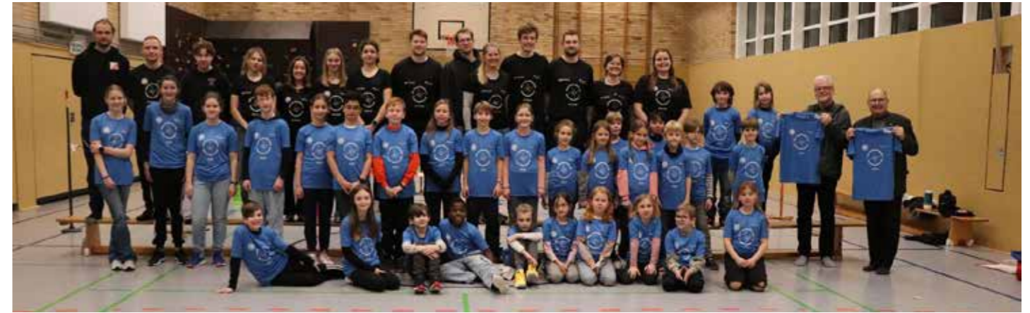
Im Vordergrund standen Spaß, Freundschaft, das gemeinsame Lernen und Sporttreiben.

Einsteigerlehrgang wird weiterhin von der TG Münden in Scheden/Dransfeld ausgerichtet