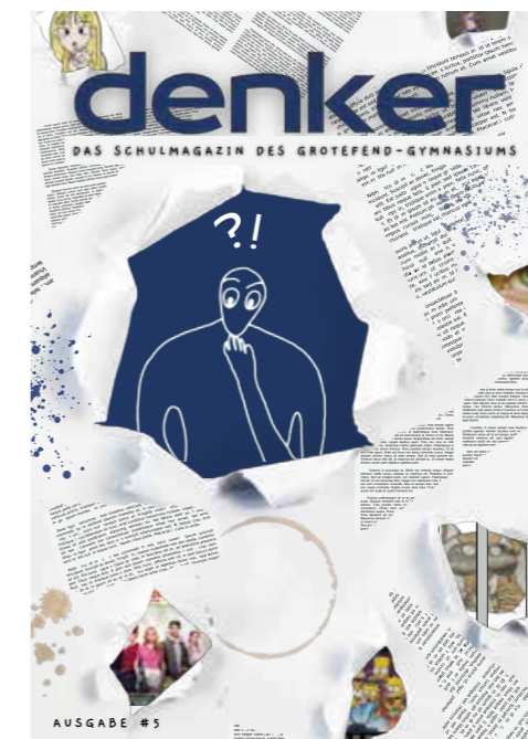
Die aktuelle Ausgabe vom „denker“ wurde im März gedruckt und begeistert erneut mit einer kreativen Gestaltung der SchülerInnen.

Die Preisverleihung fand Anfang März im Medienhaus der Madsack-Gruppe in Hannover statt. Eine Delegation aus Hann. Münden nahm Urkunde und Preisgeld in Höhe von 350 Euro persönlich entgegen. Ministerpräsident Stephan Weil, der die Schirmherrschaft des Wettbewerbs übernommen hatte, lobte die Kreativität und den Einsatz der teilnehmenden Jugendlichen. Es sei beeindruckend, wie vielfältig und engagiert junge Menschen sich mit jour-