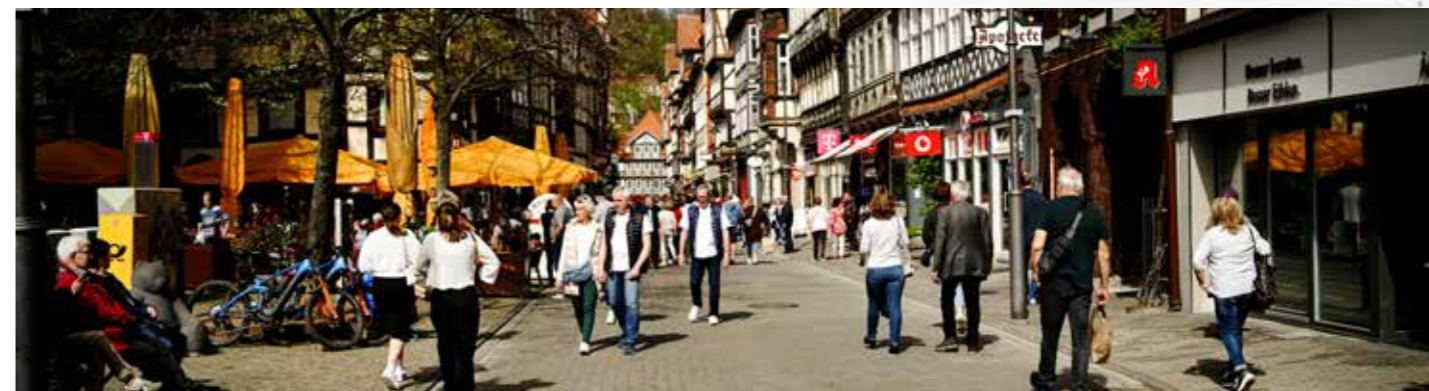
Hann. Münden lockt im Frühling mit einem verkaufsoffenen Sonntag, kleinem Frühlingsmarkt auf dem Kirchplatz und einem Ostervolksfest.

Mit sauberer Innenstadt, offenen Geschäften und buntem Rummel in den Frühlingsmodus