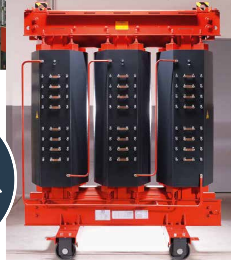
Hochspannungstechnik auf höchstem Niveau: HTT-Transformatoren „Made in Germany“ sind weltweit im Einsatz.

Tag der offenen Tür 18. MAI 12 – 18 UHR Wie freuen uns auf Sie!