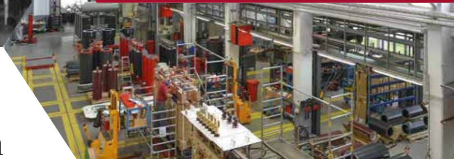
Zukunft mit Tradition: Das Team von HTT verbindet handwerkliches Know-how mit modernster Fertigungstechnologie.

Nicht nur Technikbegeisterte kommen auf ihre Kosten: Für Familien gibt es ein umfangreiches Programm, darunter eine Hüpfburg und Kinderschminken. Natürlich ist auch für das leibliche Wohl bestens gesorgt – von herzhaften Snacks bis zu süßen Leckereien wird ein vielfältiges gastronomisches Angebot bereitgestellt.