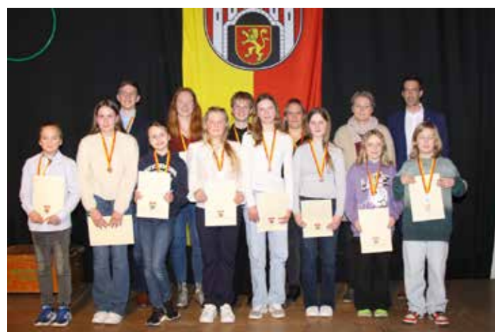
Der Mündener Kanu Club stellte die höchste Anzahl an zu ehrenden Einzelsportlerinnen und Einzelsportlern.

Ergänzt wurde das Programm durch eine eindrucksvolle Darbietung des Selbstverteidigungs- und Fitnesssportvereins sowie einen mitreißenden Auftritt der Tanzgruppe „be connected“ von Inspired by Dance. (sw/red)