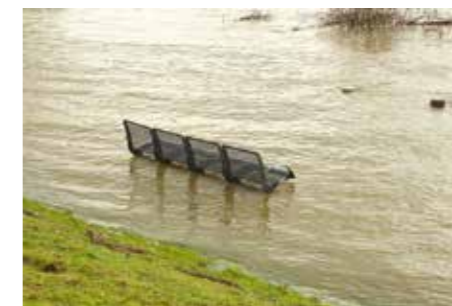
Für die Umsetzung von Hochwasserschutzmaßnahmen wurden mehr als 39 Millionen Euro in Niedersachsen bewilligt.

Schwerpunkte sind unter anderem große Rückhaltebecken, Hochwasserschutzsysteme, Deichverstärkungen oder Deichrückverlegungen.