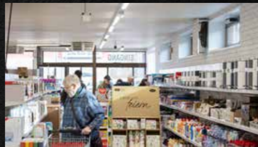
Günstige Preise und ein umfangreiches Sortiment lassen keine Wünsche offen.

zog Kunden aller Altersgruppen an. Der Mega Markt präsentiert sich als wahres Einkaufsparadies mit einem umfangreichen Sortiment. Von Hygieneartikeln, Dekowaren, Spielwaren, Möbeln und Teppichen bis hin zu Textilien, Haushaltsbedarf und Malerartikeln – das Angebot ist riesig. Besonders die großzügige Präsentation und die übersichtliche Anordnung der Produkte wird von den Besuchern gelobt.