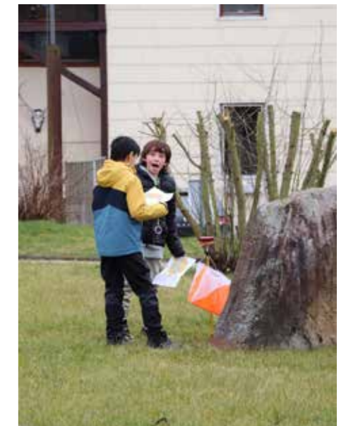
Die Kinder waren mit Spaß bei der Sache.

Auch im nächsten Jahr freuen sich die ehrenamtlichen Betreuer*innen wieder, Kinder in Scheden begrüßen zu dürfen und ihnen das Orientieren beizubringen. Dazu sind alle, die Lust haben, herzlich eingeladen!