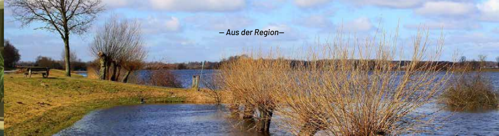
Neue Schutzmaßnahmen geplant: An der Schede, in Hann. Münden werden Uferbereiche verstärkt und Konzepte für den Hochwasserschutz umgesetzt, um Mensch, Infrastruktur und Natur besser zu schützen.