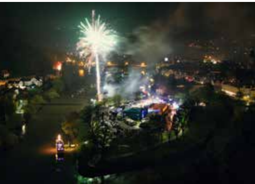
Feuerwerk zur Eröffnung am 12. April.

Veranstaltet wird das Ostervolksfest 2025 von der Hann. Münden Marketing GmbH in Kooperation mit dem Schau- stellerbetrieb Piepenschneider. Freuen Sie sich auf zehn Tage voller Spaß, Genuss und geselliger Atmosphäre! (Quelle: HMM)