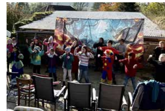
Spiel, Spaß und Farbenrausch für Kinder