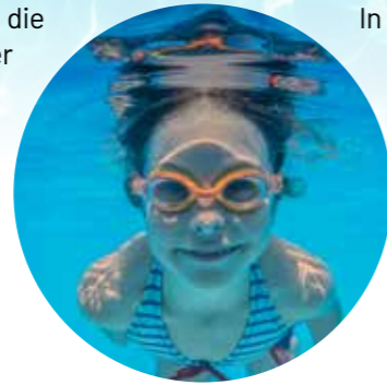
Ziel ist eine kontinuierliche Schwimmbausbildung

Der Landkreis Göttingen investiert in die Schwimmbausbildung: Ein mobiler Schwimmcontainer soll künftig überall dort eingesetzt werden, wo Hallenbäder wegen Sanierungsarbeiten vorübergehend nicht zur Verfügung stehen. Der Kreistag hat dafür im Doppelhaushalt 2025/26 insgesamt 700.000 Euro bereitgestellt. Ab 2026 wird der Kreissportbund zusätzlich jährlich 30.000 Euro Betriebskostenzuschuss erhalten. Geplant ist, den Container erstmals in Adelebsen aufzustellen – parallel zur rund 18-monatigen Schließung der dortigen Schwimmhalle.