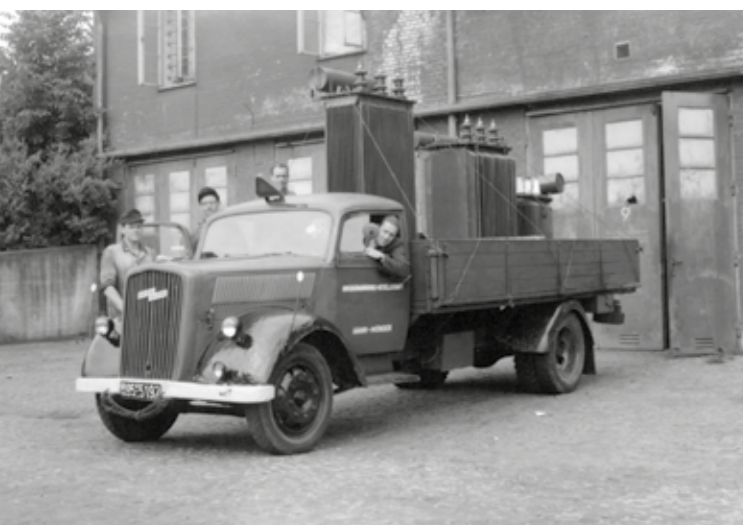
Von den Anfängen bis heute: Ein Blick zurück auf die ersten Jahre der HTT Hochspannungstechnik in Hann. Münden.

Die Wurzeln der Transformatorenfertigung in Hann. Münden reichen bis ins Jahr 1949 zurück. Die HTT GmbH wurde schließlich 1985 gegründet und entwickelte sich seither kontinuierlich weiter. Ursprünglich als inhabergeführtes Unternehmen gestartet, wurde die Firma 2007 in eine Familienstiftung überführt, um die langfristige Kontinuität zu sichern. Dieser Schritt ermöglichte es HTT, unabhängig von kurzfristigen Markttrends oder Investoreninteressen zu agieren – stets mit dem Fokus auf höchste Qualität und Verlässlichkeit.