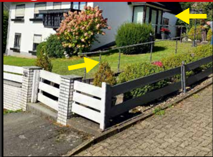
Handlauf Zuwegung zu Ihrer Haustür