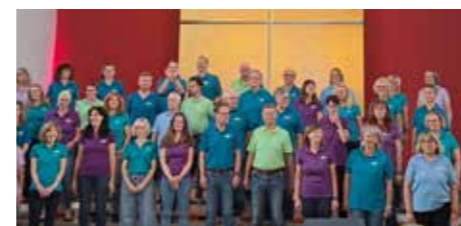
Die Mitglieder des Popchors Offbeat singen bereits seit 2008 zusammen.

Weitere Informationen zu kommenden Auftritten des Chores finden Interessierte auf der Homepage www.popchor-offbeat.de sowie auf der Facebook-Seite des Ensembles.