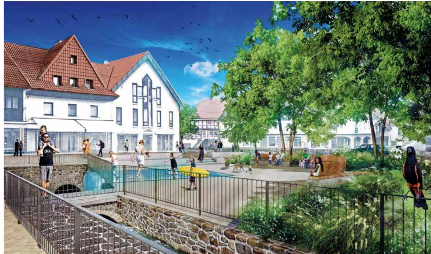
Klimaangepasster Aufenthaltsbereich im hinteren Teil mit Sitzplätzen, Wasserbassin, Grünflächen und durchlässigen Böden für ein besseres Mikroklima