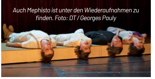
Auch Mephisto ist unter den Wiederaufnahmen zu finden.