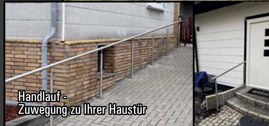
Handlauf - Zuwegung zu Ihrer Haustür