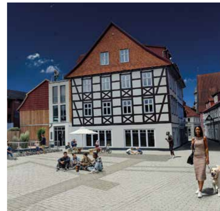
Multifunktionale, vollständig gepflasterte Fläche im vorderen Bereich mit Darstellung der historischen Mauerspuren durch unterschiedliche Pflasterungen

Ab 1947 entstand auf der freigeräumten Fläche ein Pavillonbau als Ausstellungsfläche des damaligen Modehauses Schrader. In den folgenden Jahrzehnten wurden die historischen Strukturen zunehmend überbaut und verschwanden weitgehend aus dem Stadtbild.