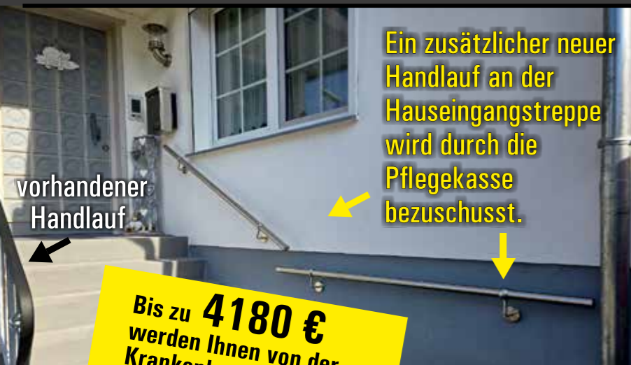
Ein zusätzlicher neuer Handlauf an der Hauseingangstreppe wird durch die Pflegekasse bezuschusst.