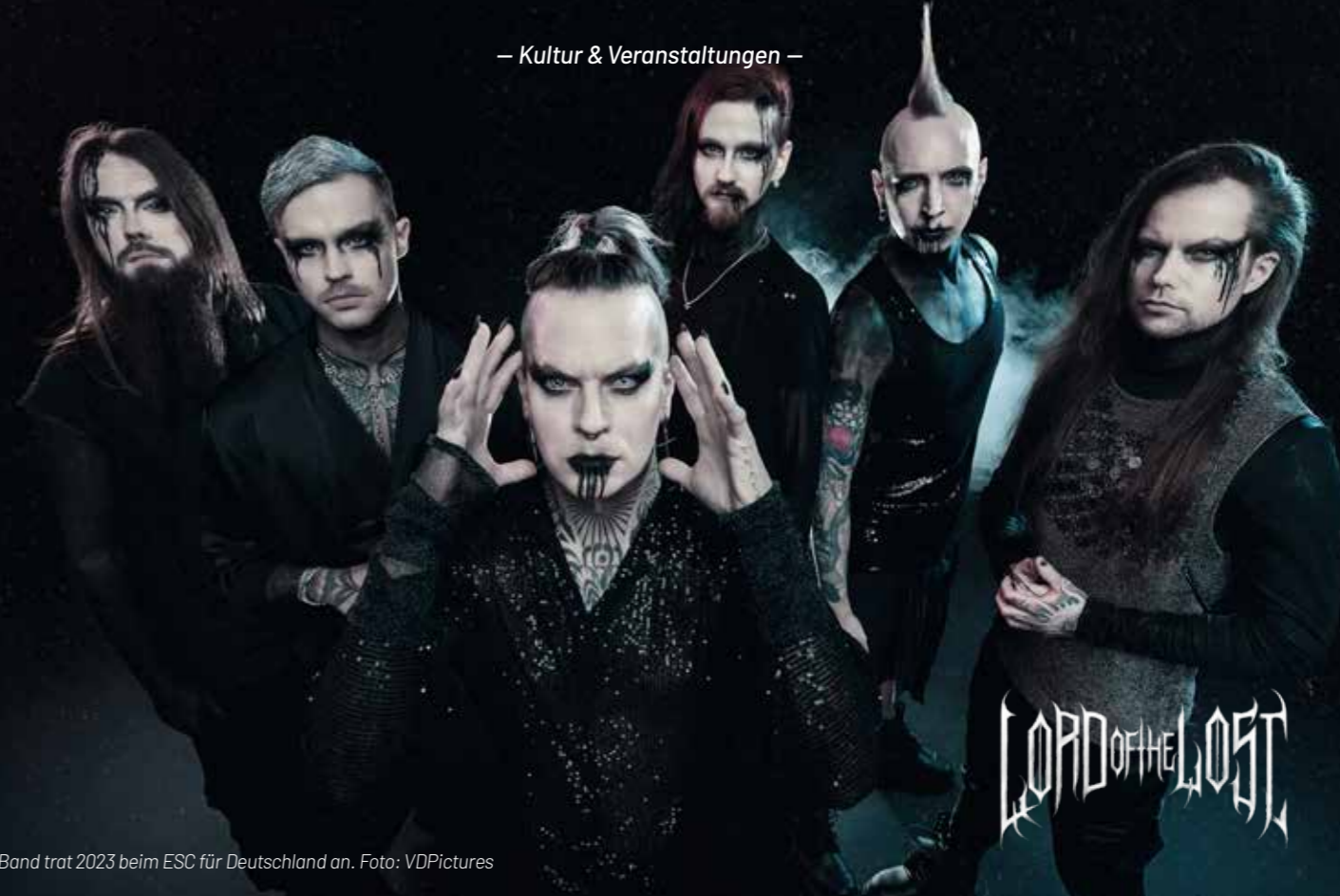
Die Band trat 2023 beim ESC für Deutschland an.