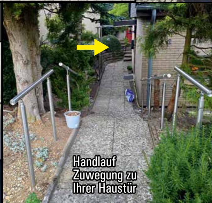
Handlauf Zuwegung zu Ihrer Haustür