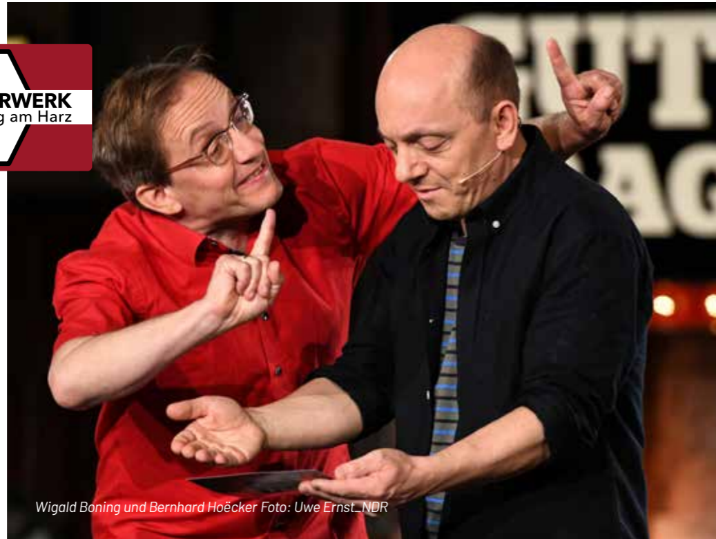
Wigald Boning und Bernhard Hoëcker

M it großer Leidenschaft für Kunst und Kultur ist es dem gemeinnützigen Verein Kulturwerk Herzberg am Harz e.V. gelungen, bereits im ersten Jahr seines Bestehens ein beachtliches Programm auf die Beine zu stellen. Im Herbst startet der Verein in seine zweite Spielzeit – und knüpft dabei nicht nur an die Erfolge an, sondern erweitert das Angebot gezielt um neue, spannende Formate.