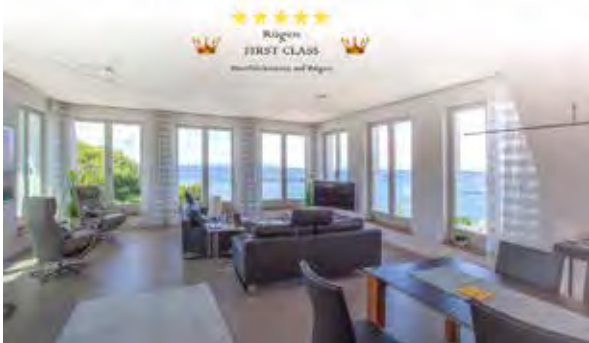
Meerblick&SPA im First Sellin

Ihre eigene Dachterrasse neben dem Skypool.