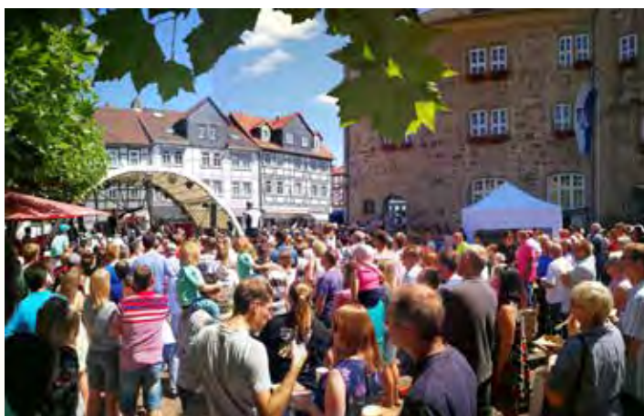
Kesperkirmes 2018

Im Sommer 2022 feiern wir mit Ihnen im idyllischen Stadtpark im Herzen von Witzenhausen. Genießen Sie unter freiem Himmel und in sommerlicher Atmosphäre ein volles Programm mit mitreißenden Konzerten, vielen Highlights und Überraschungen. Mit dabei sind wieder die altbekannten Klassiker, wie die Deutschen Meisterschaften im Kirschsteinspucken und das Kinderfest für die kleinen Kesperfans.