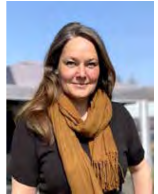
Susanne Wesche Redaktion meinWMK