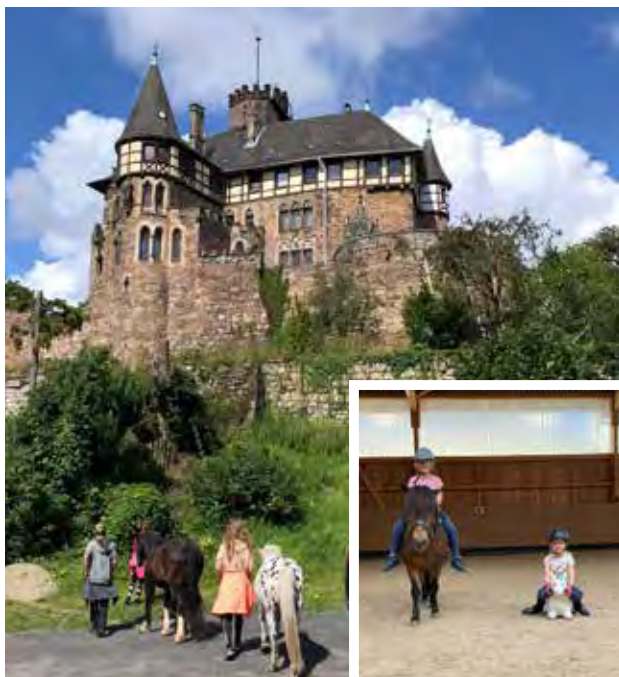
Ausflug zum Schloß Berlepsch