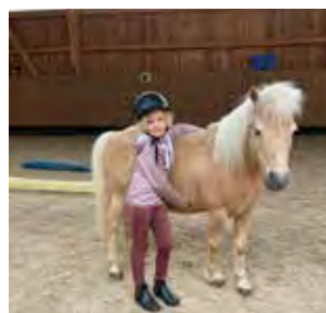
Kuscheln nach der Freiarbeit