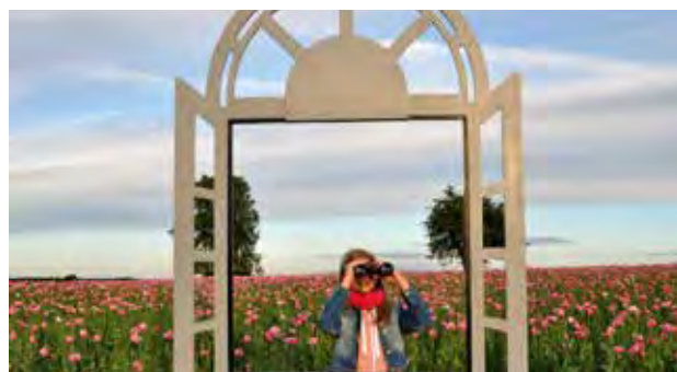
Mädchen mit Fernglas im Mohnfenster