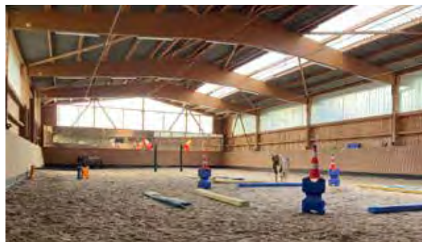
Die Bodenarbeit stärkt das Vertrauen