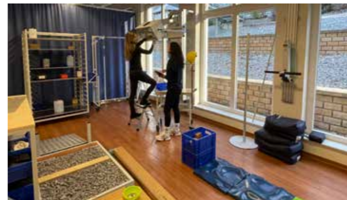
Speziell auf die Bedürfnisse der Patienten abgestimmt: Ergotherapie im sogenannten „WorkPark“ im Rehasentrum Junge (Sprangerweg 3).

Infoabend RV Fit am 26.2. um 18 Uhr - Bitte anmelden!