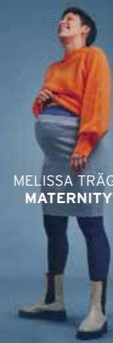
MELISSA TRÄGT MATERNITY