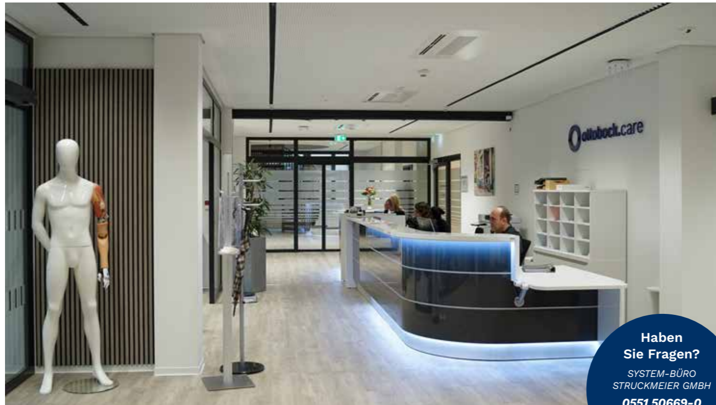
Klares Design und ansprechende Atmosphäre im Eingangsbereich von Ottobock.care in Göttingen.