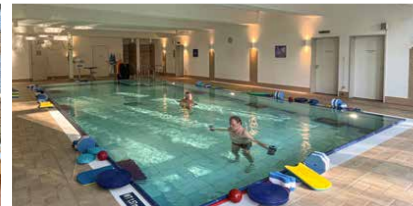
Trainieren unter Entlastung im Bewegungsbad des Rehasentrums Junge (Sprangerweg 3).

sowie Lifestyle angeboten. Verwendet wird ein nachhaltig elektrisch betriebenes Drei-Kammer-Kältesystem ohne den Einsatz von Stickstoff.