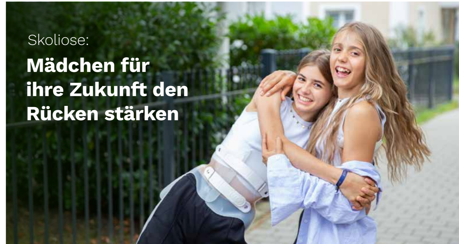
Überwiegend Mädchen sind von Skoliose betroffen. Ein Korsett sorgt für eine Stabilisierung der Wirbelsäulenverkrümmung und wirkt einer Verschlechterung langfristig entgegen.