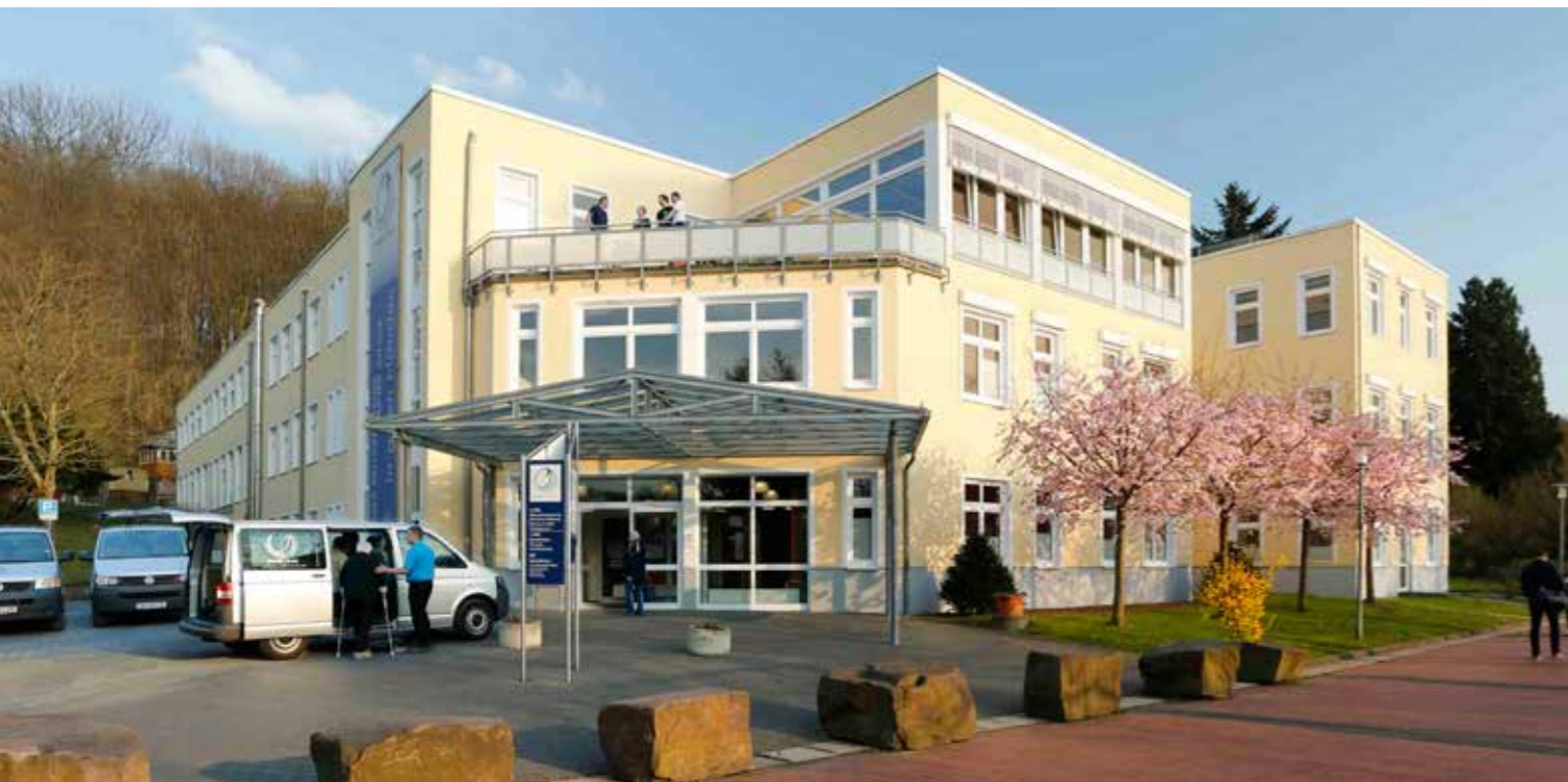
Das Rehasentrum Junge am Sprangerweg 3 ist Hauptsitz des Göttinger Traditionsunternehmens und hat sich 2021 der rehaneo-Gruppe mit Sitz in München angeschlossen.