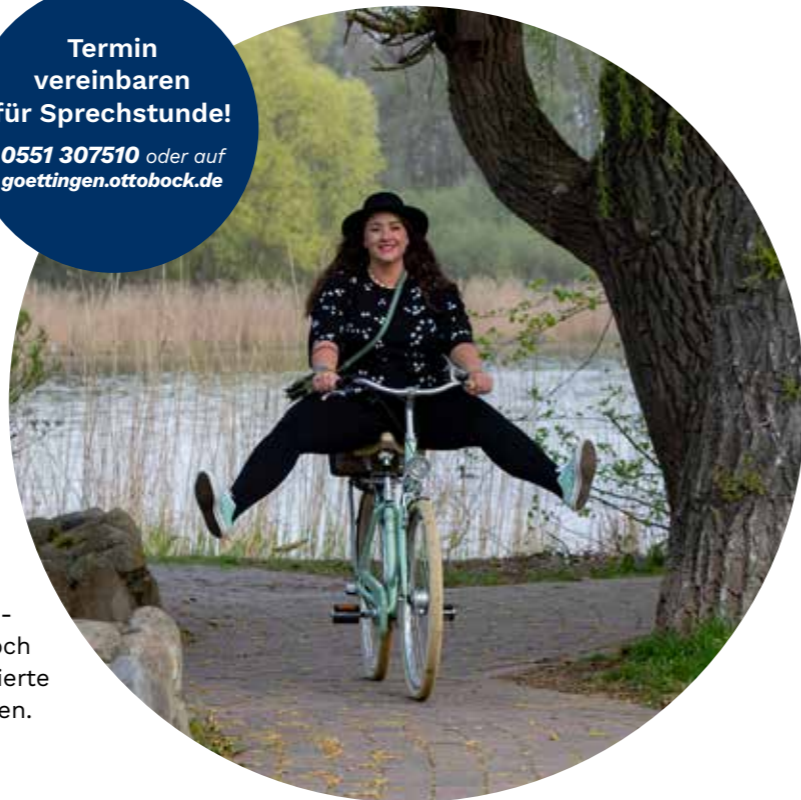
Wieder mehr vom Leben spüren: Ottobock.care bietet zum Beispiel maßgefertigte Kompressionen für Patienten mit Lymphödem und Lipödem.

Termin vereinbaren für Sprechstunde! 0551 307510 oder auf goettingen.ottobock.de