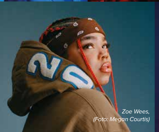
Zoe Wees