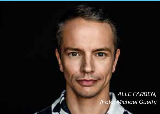
ALLE FARBEN, (Foto: Michael Gueth)