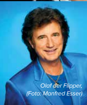
Olaf der Flipper, (Foto: Manfred Esser)