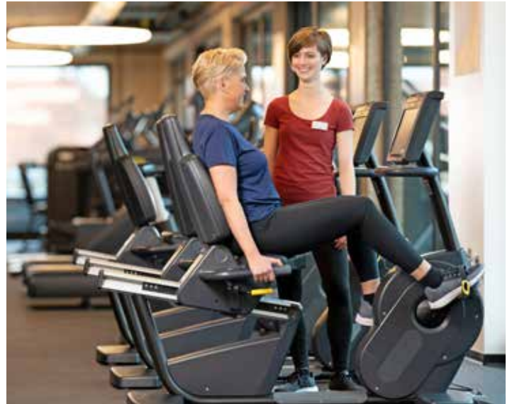
In der Zeit der Pandemie ist die Bedeutung von Fitness- und Gesundheitsanlagen im Bewusstsein von Gesellschaft und Politik gewachsen.

Wegen der großen Nachfrage nach Fitness- und Gesundheitstraining muss eine bedarfsgerechte und fundierte Betreuung aller Mitglieder, die in Fitness- und Gesundheitsanlagen trainieren, sichergestellt sein. Entsprechend groß ist das Potenzial für gut ausgebildete Fachkräfte. Qualifizieren können sich künftige Fitness- und Gesundheitsexperten beispielsweise an der staatlich anerkannten Deutschen Hochschule für Prävention und Gesundheitsmanagement (DHfPG). Diese bietet sieben duale Bachelor-Studiengänge, vier Master-Studiengänge, ein Graduiertenprogramm sowie über 100 Hochschulweiterbildungen in den Bereichen Prävention, Gesundheit, Ernährung, Fitness, Sport und Informatik an. Zudem können sich Interessierte in Lehrgängen der BSA-Akademie nebenberuflich im Zukunftsmarkt Prävention, Fitness und Gesundheit qualifizieren