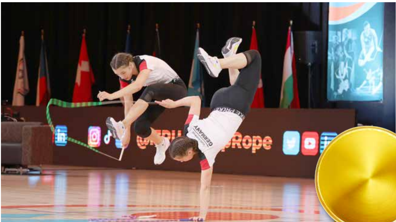
Bei diesem Tempo können selbst die Kampfrichter nicht alle Details mit dem bloßen Auge erkennen.

Nun trainieren sie wieder Woche für Woche in ihrem 1.000-Seelen-Dorf oben auf dem Roringberg. Vielleicht lassen sich dort in Zukunft ja auch mal ein paar Auswärtige im Roringer Dorfladen oder Berg Café blicken, um sich ein Bild vom Dorf der Weltmeisterinnen zu machen. Lutz Conrad