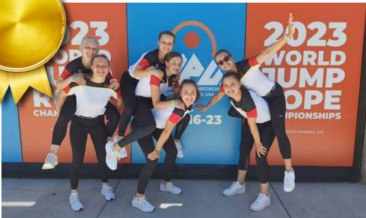
Die Rope Skipperinnen des TV Roringen hatten in Colorado Springs (USA) jede Menge zu feiern.