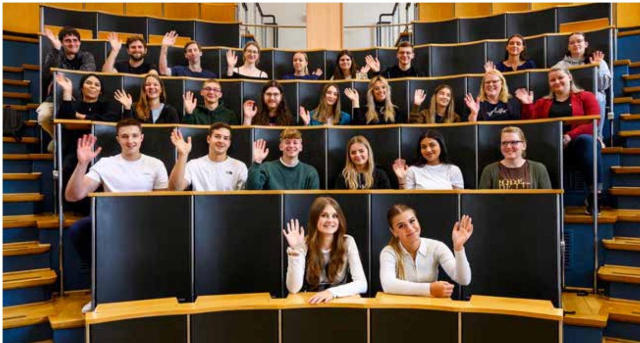
26 neue Auszubildende in elf Berufen starteten am 1. August in der Universitätsmedizin Göttingen, UMG.