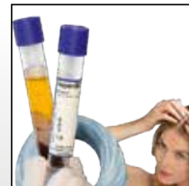
Eigenblutbehandlung mit PRP