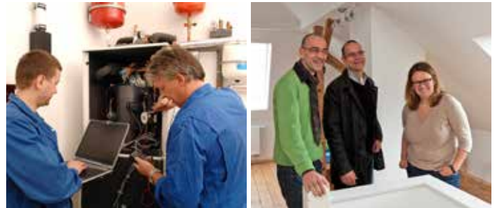
Verbraucherschützer empfehlen, auch bei kleineren Handwerkeraufträgen schriftliche Verträge zu schließen.

Besonders bei den Zahlungsvereinbarungen sollten die Auftraggeber genau hinsehen, empfiehlt Stange. Das Bürgerliche Gesetzbuch (BGB) räumt Handwerkern das Recht auf eine Abschlagszahlung ein, da sie mit Material- und Personalkosten in Vorleistung gehen - allerdings erst, wenn durch die Handwerkerleistungen ein Wertzuwachs erreicht ist. Eine „Zahlung bei Auftragsbestätigung“ muss jedoch nicht akzeptiert werden. Zudem ist zu prüfen, ob die Höhe einer geforderten Zahlungsrate tatsächlich dem Wert der erbrachten Leistung entspricht. Stange weist zudem darauf hin, dass bei großen Umbau- oder Modernisierungsmaßnahmen ein Verbraucherbauvertrag zustande kommt. In diesem Vertrag gehört zu den Pflichten von Handwerker und Auftraggeber ein Sicherungseinbehalt in Höhe von fünf Prozent der vereinbarten Gesamtvergütung.